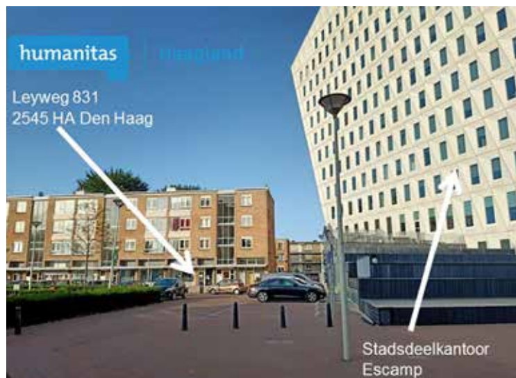
Het huidige adres van Humanitas Haagland

Zo hebben we mensen onder andere aan een fiets, een ijskast, een televisietoestel, een wasmachine, een laptop en een aangepaste stoel kunnen helpen.