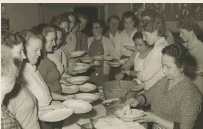
Kookdemonstratie voor plattelandse vrouwen, jaren vijftig