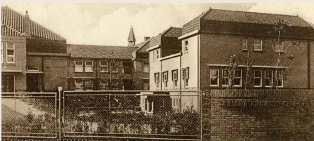
Juliana Kinderziekenhuis. Prentbriefkaart uit 1930