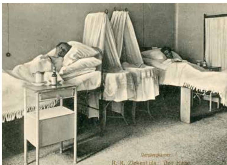
De verpleegkamer met wiegen van Johannes de Deo. Prentbriefkaart uit 1914, Haags Gemeentearchief

In 1877 werd een naastgelegen pand betrokken waar op de eerste etage ongeneeslijke patiënten zouden worden verpleegd. De eerste grote verbouwing kwam in 1882 tot stand. Voor dat doel werden aangekocht en gesloopt een aangrenzend huis met tuin en houtloods, drie pakhuizen met bovenwoningen en een hofje van negen huisjes. In het bouwplan werden ideeën van Pater Marijnen verwerkt. Zo was hij een groot voorstander om het ziekenhuis te verdelen in paviljoenen. Naast de zalen was er ook aandacht voor badkamers, theekeukens, toiletten, bewaarplaatsen van kleding en bergings-