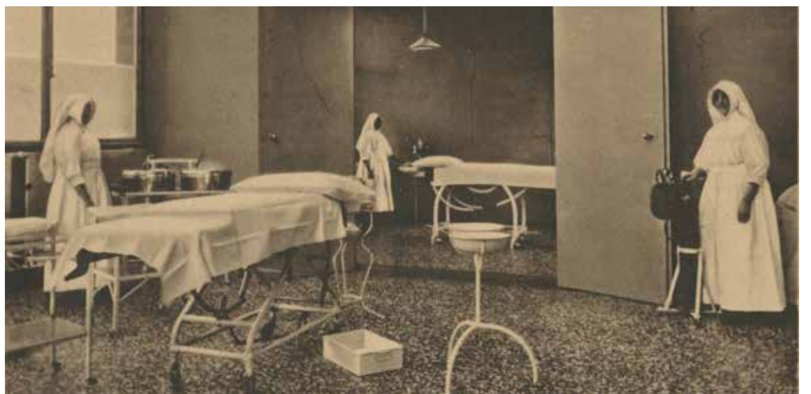
De operatiekamer van het ziekenhuis Johannes de Deo. Prentbriefkaart uit 1925