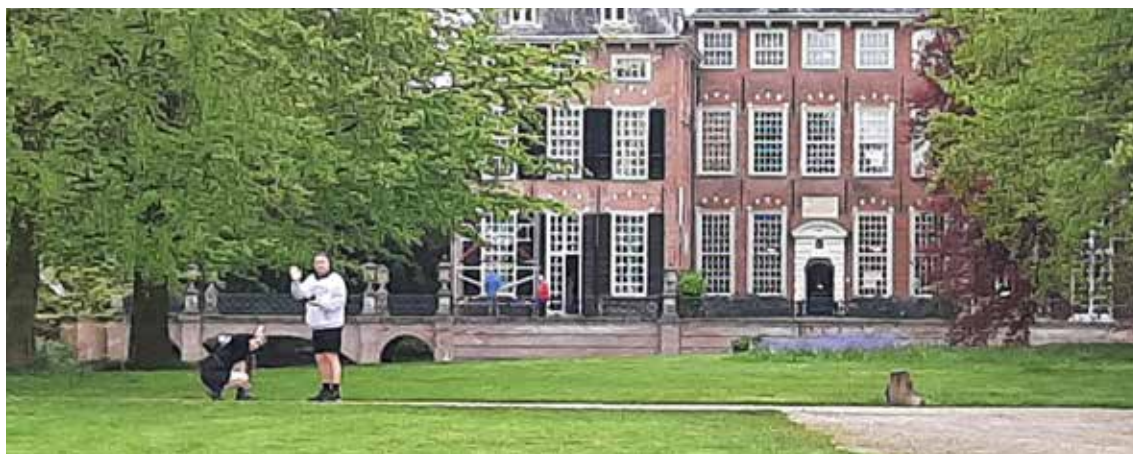
Een trainingsronde op het domein van Kasteel Duivenvoorde