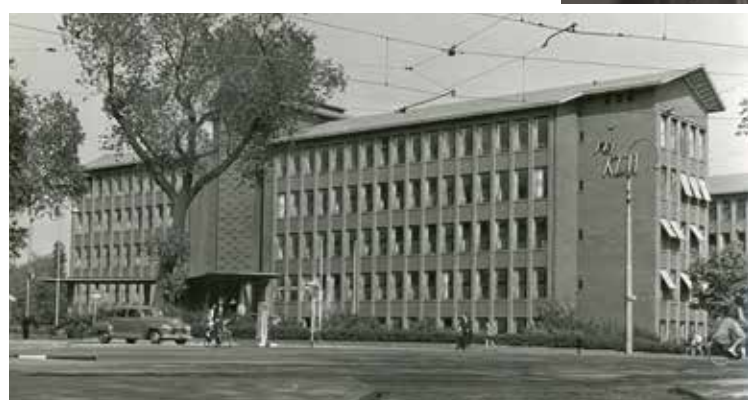
KLM gebouw, Plesmanweg ca. 1955.

Persoonlijk wordt Albert Plesman hard geraakt door de oorlog. Hij wordt beschuldigd van het ondermijnen van het Duitse gezag en zit daarom van 9 mei