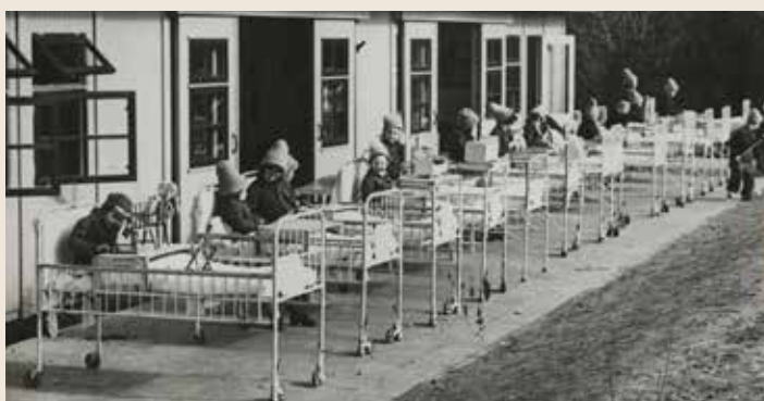
Dr. Van Welylaan, Juliana Kinderziekenhuis, Irene Paviljoen, 1947.