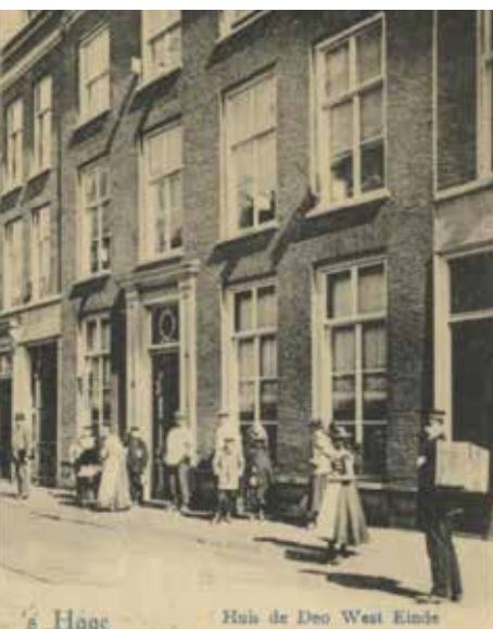
De voorgevel van het ziekenhuis in 1902

en reinigingsruimten voor onder andere potten, urinalen en sputumflessen. Het was de eerste uitbreiding van de velen die zouden volgen. Het nieuwe ziekenhuis bood plaats aan honderd bedden. Men ging ervan uit dat de verruiming voor langere tijd genoeg zou zijn. Maar in 1890 bleek het ziekenhuis alweer veel te klein te zijn.