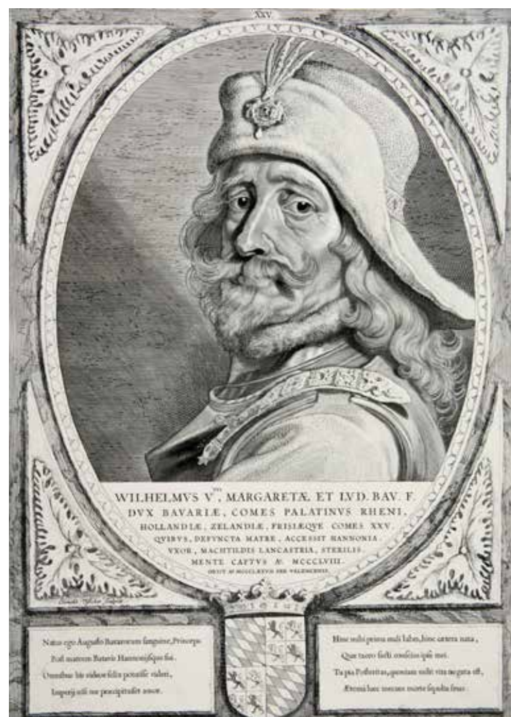
Willem V door Cornelis Visscher in 1653.

Ter illustratie een afbeelding van een woudman uit de dertiende eeuw. Deze vond ik in het slot Rodenegg ten noordoosten van Brixen, Zuid-Tirol. Deze woudman heet Iwein. Het Iwein-epos, een van de koning Arthur verhalen, vertelt dat Iwein na veel avonturen de wildernis in vlucht, na diep teleurgesteld te zijn in de liefde. Zijn eergevoel is grondig aangetast en hij is wanhopig. Hij wil er niet meer zijn en haat zichzelf. Zijn verdriet is zo verpletterend dat hij de kleren van zijn lijf trekt en verdwijnt in de verlatenheid. Ook hij wordt geholpen en uiteindelijk komt het goed met Iwein. 2