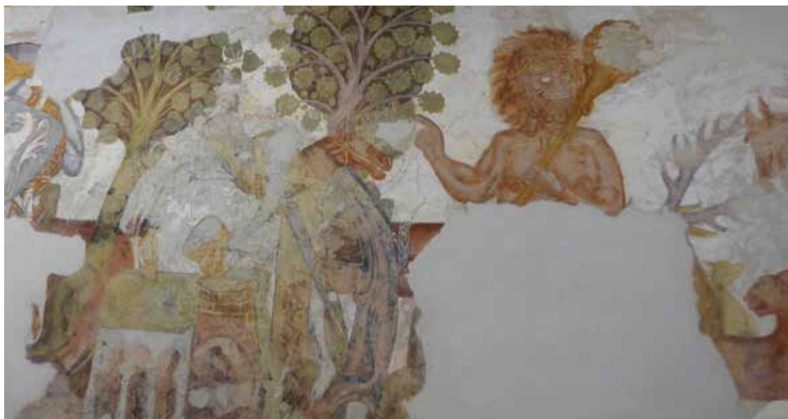
Iwein in slot Rodenegg

komen, maar dat lukt niet altijd. De middeleeuwse mens ziet dat de woudman hulp nodig heeft en wil die geven. Die hulp bestaat uit het wassen van de woudman en hem te scheren. Ook geven ze kleding, voedsel en medicijnen. Vaak laten ze, want het zijn vaak meerdere mensen die hulp bieden, hem laten luisteren naar muziek en ze spreken heilige of magische formules over hem uit. Soms helpt dat. Als een woudman geholpen is en weer wil gaan, kan dat. Meestal komt hij dan af en toe terug voor verzorging, voedsel en mededogen. Kennelijk doet de behandeling hem goed. Helaas wordt hij nogal eens door opgroeiende kinderen en knechten geplaagd. Ook kan hij slachtoffer worden van honger en oorlogen. Agressief gedrag van een woudman leidt vaak tot angst. Zo komt hij ook in sprookjes terecht, vaak als de kwade reus of een slechte dwerg.