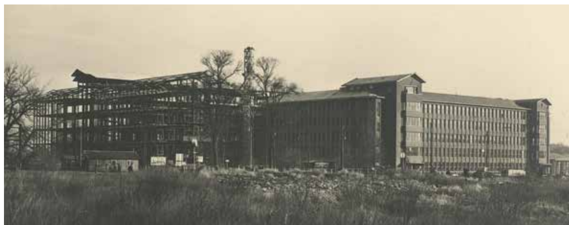
Plesmanweg, gebouw van de K.L.M. met links een nieuwe vleugel in aanbouw. Foto uit 1948, Haags Gemeentearchief