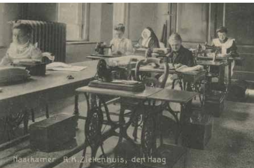
Naaikamer R.K. Ziekenhuis, den Haag