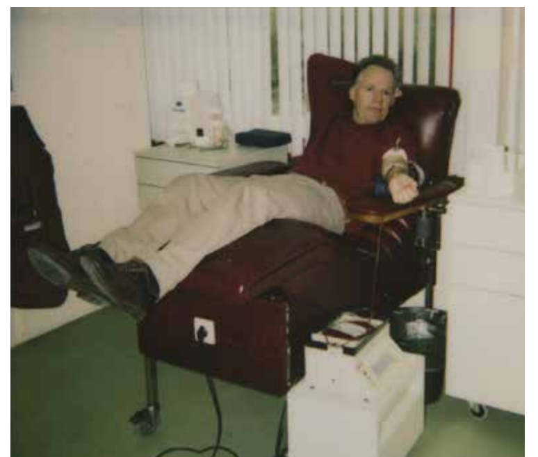
Mijn 50ste bloeddonatie

Begin jaren tachtig begint de ziekte Aids bekend te worden. Aids kan ook via bloedcontact worden overgedragen. Het is in Frankrijk en Engeland voorgekomen dat donatiebloed besmet was en patiënten daardoor besmet raakten met Aids. Het bloed van donoren mag dus geen sporen van een Aids-besmetting vertonen. Gelukkig is in Nederland niemand via het