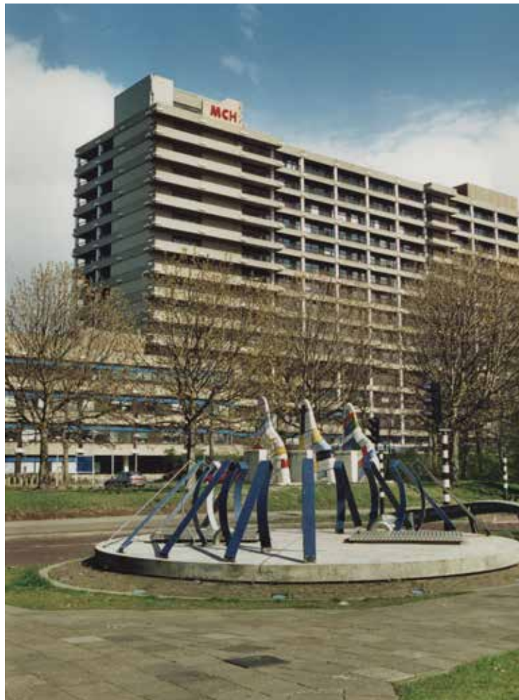
Lijnbaan, zicht op het Medisch Centrum Haaglanden, Westeinde. Foto uit 2000, Kees Klerk, Haags Gemeentearchief

Dokter Aemilius Antonius Maria Hanlo (1835-1896) verklaarde dat hij belangeloos de genees- en heelkundige hulp op zich zou nemen. Apotheker Hendricus