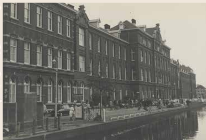
Zuidwal Ziekenhuis. Foto uit 1967, J.Ph. Bronkhorst, Haags Gemeentearchief

aan een scheurtje in de dikke darm, veroorzaakt door het stuur van zijn fietsje bij de klap op de auto. Hij herstelde gelukkig vlug en... leerde onder de strenge begeleiding van de verpleegsters echt eten, want daarvoor kregen wij uitsluitend appelmoes en eventueel een ei bij hem naar binnen. Hij werd later een van de beste eters die ik ooit gekend heb.