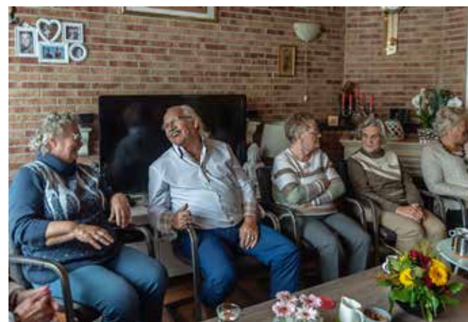
Koffie bij de Laakse Lente.