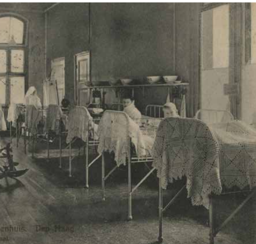
Prentbriefkaart uit 1915