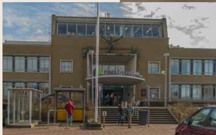
Links en boven: Haga Ziekenhuis locatie Sportlaan.

Dan gaat er een lange tijd voorbij zonder relevante medische ondersteuning of ervaring. Totdat ik trouw, vader word en kennis maak met de kraamzorg. Mijn vrouw had haar consulten bij de destijds kraamkliniek aan De La Reyweg en maakte gebruik van de diensten van mevrouw Simonis, toen nog vroedvrouw geheten. Zij was voortreffelijk, deskundig en vriendelijk. Ze bracht rust in een omgeving, waar voor het eerst echt kennis werd gemaakt met de fenomenen zwangerschap en bevalling. Deskundigheid en