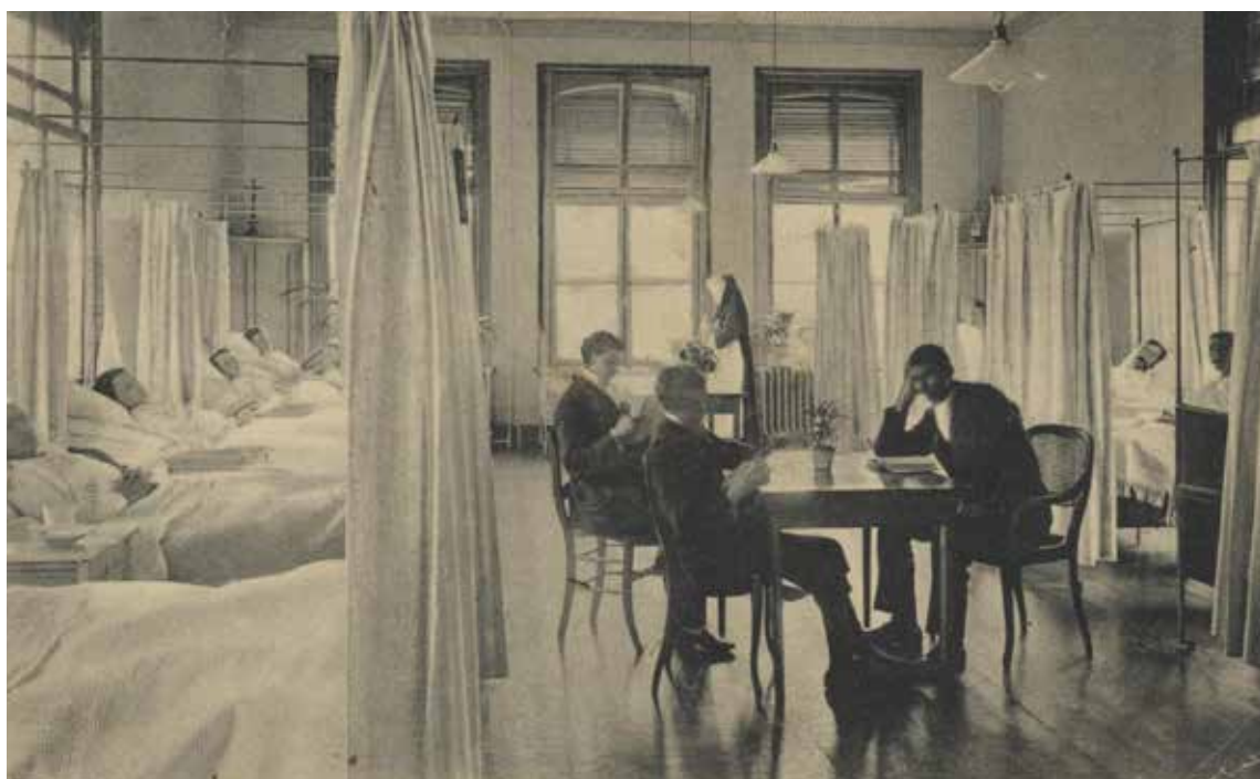
De mannenzaal van het ziekenhuis Johannes de Deo. Prentbriefkaart uit 1915

een nieuwe eigentijdse operatiekamer die op dat moment de beste in Nederland was. Het was ruim, luchtig en geheel van steen en ijzer gebouwd, met gemakkelijk te reinigen muren, afgeronde hoeken, een granietvloer en voorzien van twee tegenover geplaatste ramen en een bovenlicht terwijl 's avonds twee Siemens lampen de nodige verlichting gaven. Een jaar eerder waren de onhygiënische stoffen vloeren van de drie grote ziekenzalen al vervangen door zeilbedekking. Om dezelfde reden werden in 1897 de jaloezieën naar de buitenkant van de