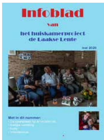
Dit blad verscheen enkele keren per jaar