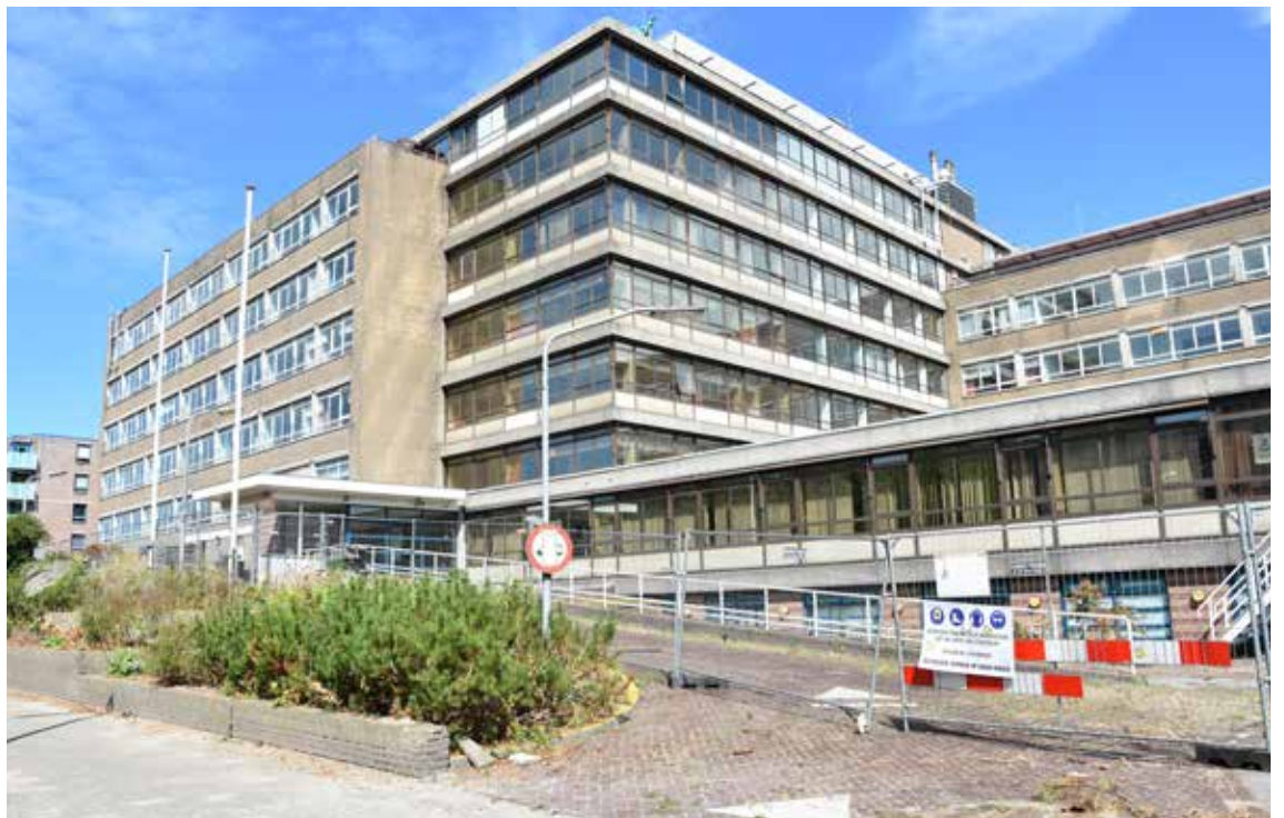
Lozerhof, Randweg 64, met op de voorgrond de hellingbaan naar de hoofdingang.