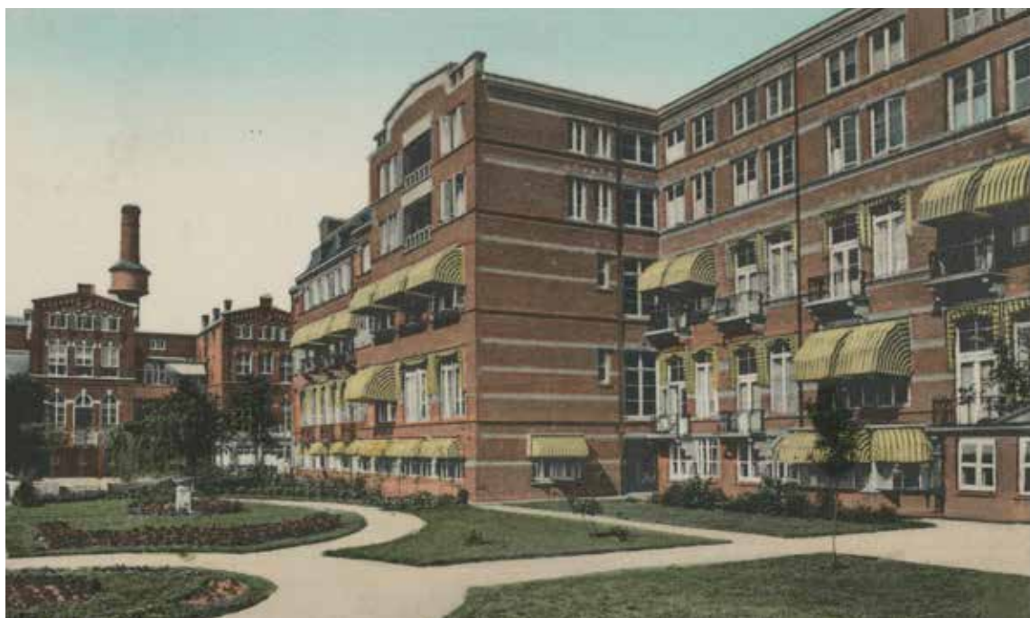
Clemensvleugel van het R.K. Ziekenhuis St. Joannes de Deo. Prentbriefkaart uit 1930

In 1895 kreeg het ziekenhuis na veel inspanning van Mastboom