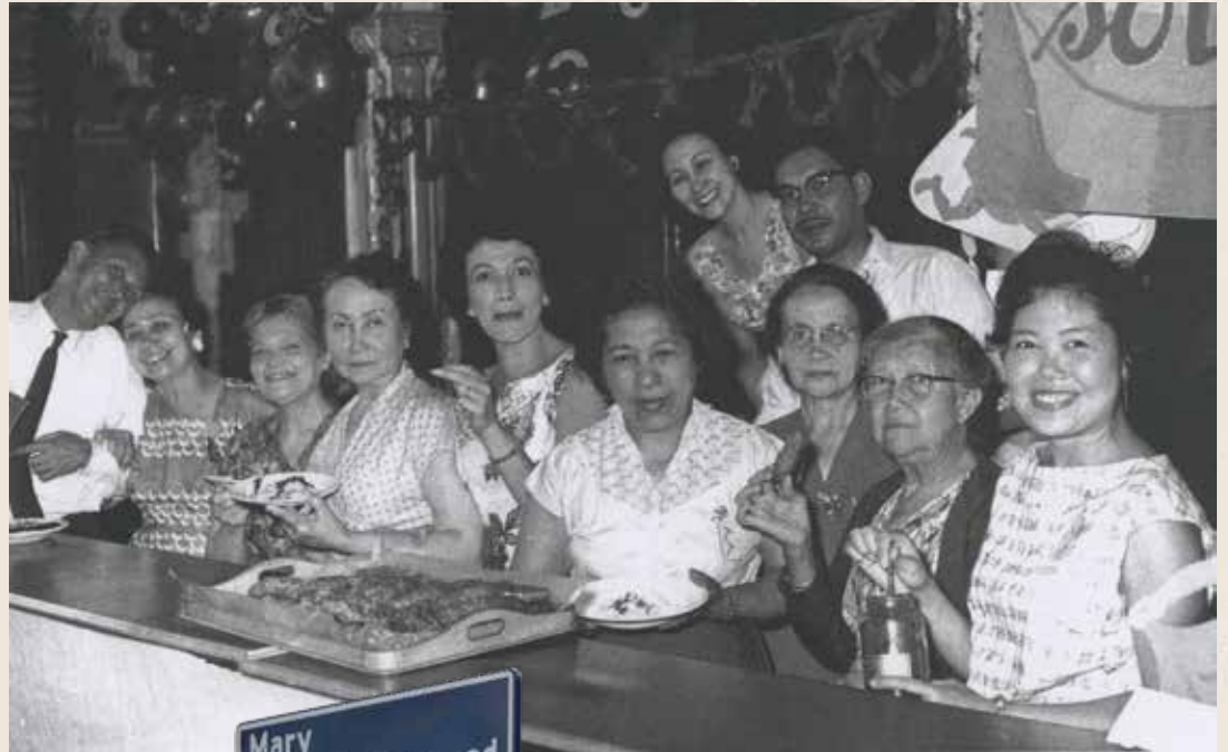
Pasar Malam 1961

Mijn vader is geboren in Amsterdam in 1902. Een paar jaar later verhuisde zijn gezin naar Den Haag. Na zijn studie in Leiden werd hij in 1930 uitgezonden naar Nederlands-Indië. Als controleur 1e klasse heeft hij op verschillende standplaatsen van Indië gediend. Hij kwam kort na aankomst in Nederland in dienst bij het Ministerie van Binnenlandse Zaken, waar hij begon als Rijks-hoofdamtenaar op de afdeling Grondwet- en