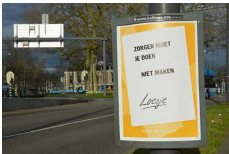
Het motto van de Laakse Lente