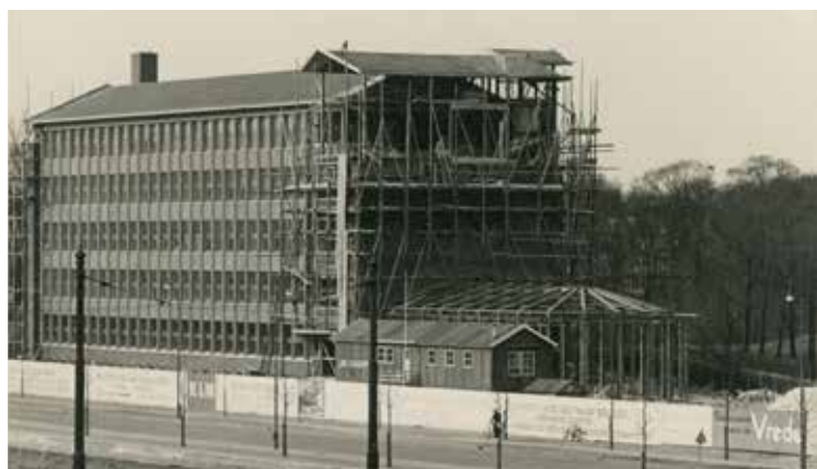
KLM-gebouw in aanbouw. Beeld van vlak voor de oorlog (zie bord 'bidden werkt voor de vrede', rechtsonder). Foto uit 1940, S. Oppelaar, Haags Gemeentearchief

www.resources.huygens.knaw.nl www.wittebrugpark.nl www.omroepwest.nl www.blog.klm.nl www.isgeschiedenis.nl www.historiek.net