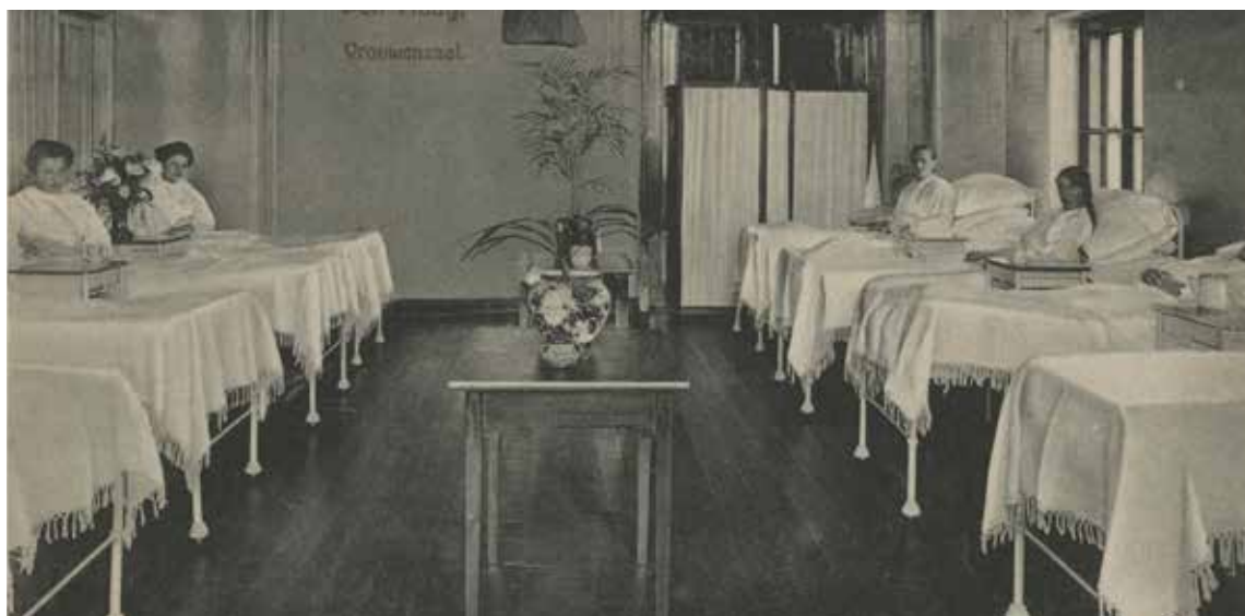
De vrouwenzaal van het ziekenhuis Johannes de Deo. Prentbriefkaart uit 1914