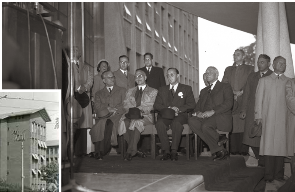
Genodigden bij de ingebruikneming van het hoofdkantoor van de KLM aan de Plesmanweg. In het midden prins Bernhard, rechts naast hem Dr. A. Plesman.

hierbij aanwezig, inclusief prins Bernard. Aan hem was de eer om de laatste steen te plaatsen. Dit was overigens een heel bijzondere steen. In de zeventiende eeuw was deze namelijk door Nederland meegenomen naar Nieuw-Amsterdam, het huidige New York. President Roosevelt schonk de steen in 1933 aan het Museum of the City of New York. Dit museum gaf de steen in 1946 vervolgens aan koningin Juliana, ter gelegenheid van de opening van de luchtlijn Amsterdam-New York, met het verzoek er een goede bestemming voor te vinden.