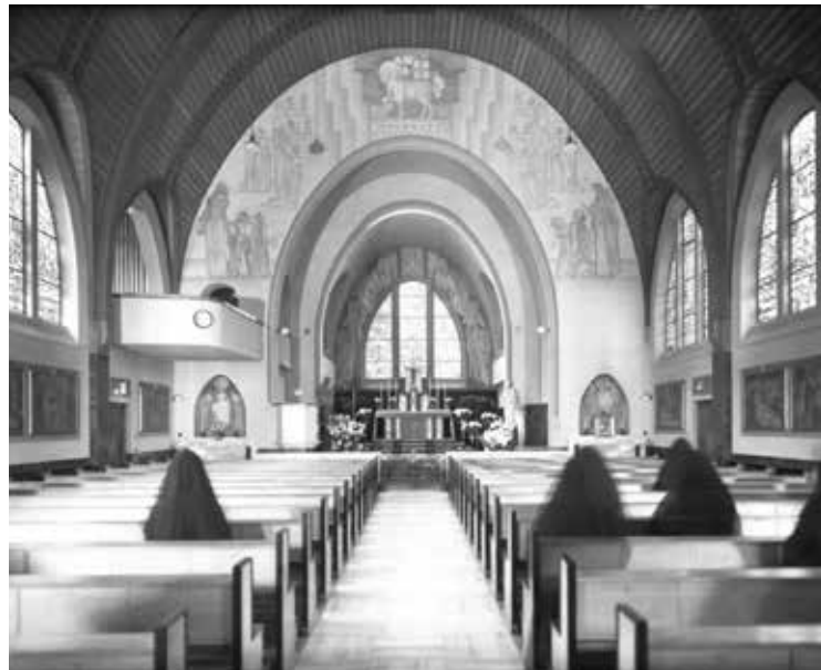
Het interieur van de kapel van het ziekenhuis. Foto uit 1935