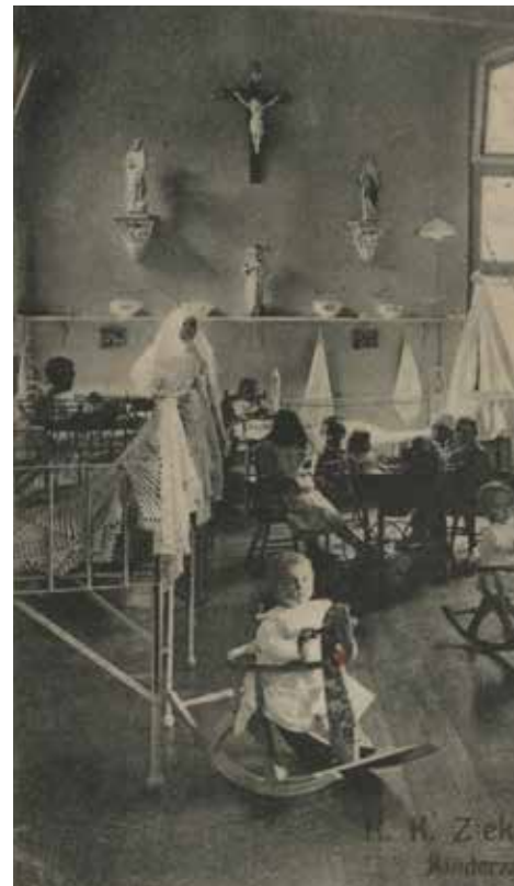
De kinderzaal van het ziekenhuis Johannes de Deo. Prentbriefkaart

Op 7 augustus 1873 werd het ziekenhuis officieel geopend. Op die dag werd ook de eerste patiënt opgenomen. Begonnen werd met tien bedden. Vier voor mannen en zes voor vrouwen. In het eerste jaar werden 53 patiënten verpleegd, die samen 1624 verpleegdagen in het