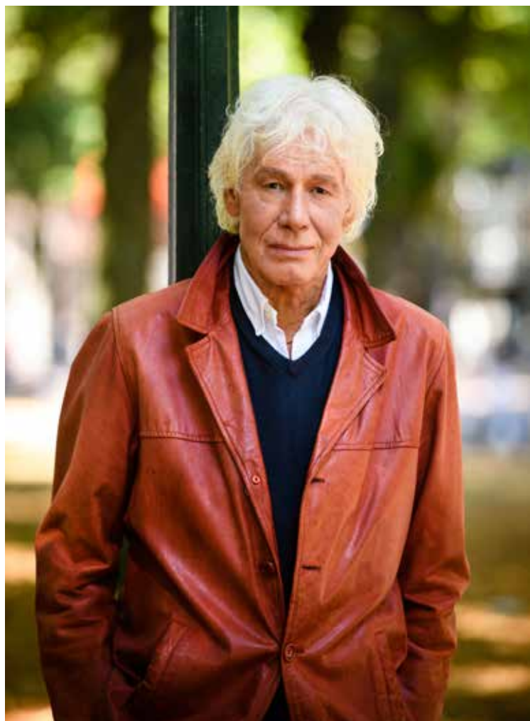
Paul van Vliet.

Comité van Aanbeveling: Freek de Jonge, Herman van Veen, Brigitte Kaandorp, Anne Wil Blankers, Monique van de Ven, Cees Debets, Jochem Myer, Harrie Jekkers, Youp van 't Hek