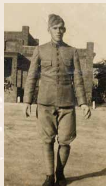
Alexander Kazerne Den Haag, speciale laarzen van mijn vader met Poeties omwikkelingen waren erg bewerkelijk

Met kleine vluchtkoffertjes zat mijn familie onderaan de trap bibberend van angst en van de voelbare trillingen door de zware bombardementen. Na het geraas was alles weer veilig voor de dag. Het bombardement duurde van 8.30 uur tot 9.45 uur. De in België opgestegen bommenwerpers kregen boven Tilburg het weerbericht van windkracht 3 Bf door en boven Den Haag bleek dat 5 Bf te zijn. Dienst-