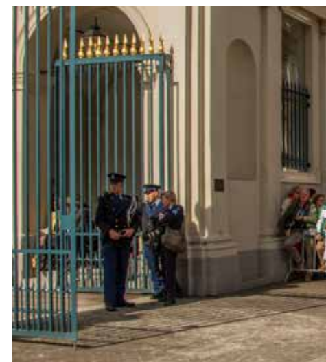
Publiek achter een dranghek naast het paleis Noordeinde

Op de grens van traditie en folklore zijn de jaarlijkse bezoeken van personen in klederdracht aan Prinsjesdag. Op televisie zien wij hen geïnterviewd worden met de terugkerende vraag of zij ieder jaar naar Den Haag komen. Uiteraard, want het is mooi om het koningspaar te zien en het is ook een gezellig dagje uit. Daar staan zij niet alleen in. Veel toeschouwers kleden zich al dan niet uitbundig in het oranje, soms zelfs met een nepkroontje, sjerp en medailles. Anderen dragen speciale hoe-