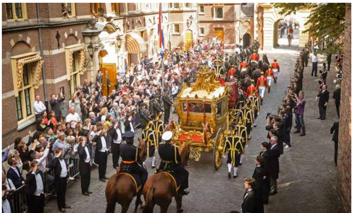
Vertrek van de Gouden Koets op Prinsjesdag 2014.

tot 2015 werd hij op een aantal onderbrekingen na tijdens Prinsjesdag gebruikt. Van 1914 tot 1930 werd hij niet gebruikt en dat geldt ook voor de periode van 1940 tot 1948. Ook tijdens de bezetting van de Franse Ambassade in 1974 was dit het geval. De afbeelding 'Hulde der Koloniën' op een der panelen gaf aanleiding om de Gouden Koets niet meer voor officiële doeleinden te gebruiken. Hoewel deze afbeelding zo'n 125 jaar geleden is aangebracht en in die tijd kennelijk geaccepteerd werd, is het de vraag of zo'n voorstelling in deze tijd nog kan. De meningen hierover waren en zijn verdeeld, maar het is hier niet de plaats om daar verder op in te gaan.