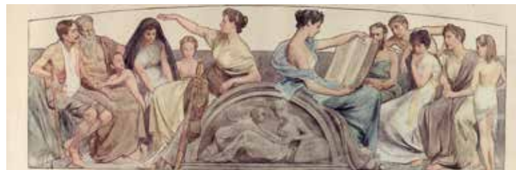
De voorzijde symboliseert de toekomst

Deze figuren zijn gekleed in Romeinse gewaden en symboliseren de Hollandse welvaart. Laat ik er twee als voorbeeld nemen. De toekomst: de paneelschildering aan de voorzijde symboliseert de ideale toekomst met verbeterde sociale voorzieningen. Vrouwe Justitia beschermt de hulpbehoevenden en het volk krijgt goed onderwijs. Het verleden: de paneelschildering op de achterzijde besteedt