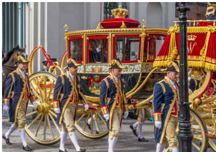
De Glazen Koets met het koninklijk paar vertrekt van paleis Noordeinde. Foto uit 2017, Harry van Reeken, Haags Gemeentearchief.

Langs de route vormen diverse legeronderdelen erewachten,