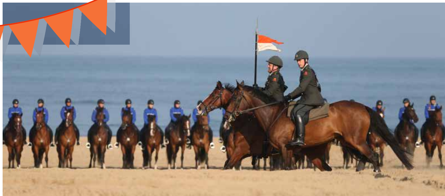
Oefening op het strand voor Prinsjesdag. Foto uit 2014, Frank Jansen, Dienst Stedelijke Ontwikkeling, Haags Gemeentearchief