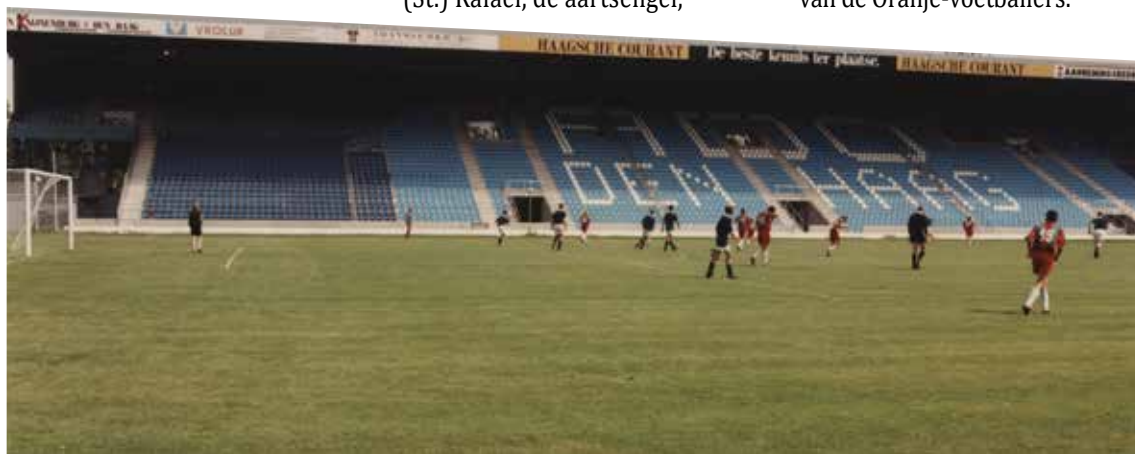
Voetbalclub ADO Den Haag speelt een oefenwedstrijd op het veld in het Zuiderpark. Foto uit 1993, Leo van Hulten, Haags Gemeentearchief