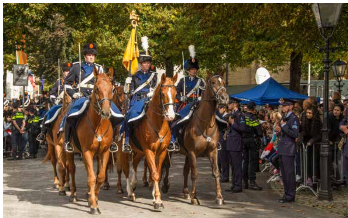
Ruiters in de Paleisstraat op Prinsjesdag. Foto uit 2017, Harry van Reeken, Haags Gemeentearchief

Dit alles speelt zich buiten af, maar binnen is ook het een en ander te zien. Wat te denken van de hoedenparade van de vrouwelijke Kamerleden. Hun keuzes zijn altijd goed voor kritische of bewonderende commentaren. Bepaald niet leuk is het wanneer het hoofddeksel van een kamerlid wordt gekwalificeerd