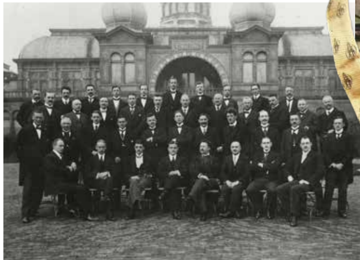
De mannenzangvereniging 'Die Haghe-Sanghers' vóór de Dierentuin. Foto uit 1920, en rechts: Lint DHS