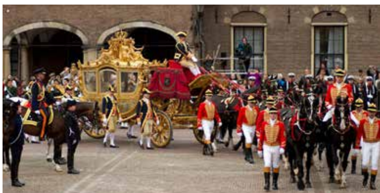
Aankomst van de Gouden Koets op het Binnenhof, Prinsjesdag 2011.