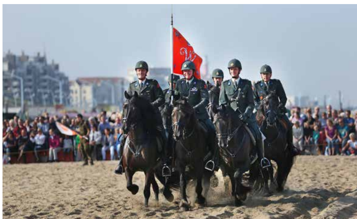
Oefening op het strand voor Prinsjesdag. Foto uit 2014, Frank Jansen, Dienst Stedelijke Ontwikkeling, Haags Gemeentearchief

Tweede kamer wordt aangeboden door de Minister van Financiën. Sommige plannen lekken al enige weken daarvoor uit, meestal in de vorm van korte mededelingen, maar de troonrede niet. Dat komt omdat daar vaak nog tot op het laatst in gewijzigd wordt. De koning ontvangt de tekst in grote lijnen al enige dagen van tevoren om te oefenen. Het voorlezen luistert nauw, geen woord mag worden overgeslagen en het moet duidelijk verstaanbaar zijn. Na het voorlezen vouwt hij de blaadjes dicht, overhandigt die aan de bode achter de troon en verlaat met de koningin aan zijn zijde de zaal. De cabaretier