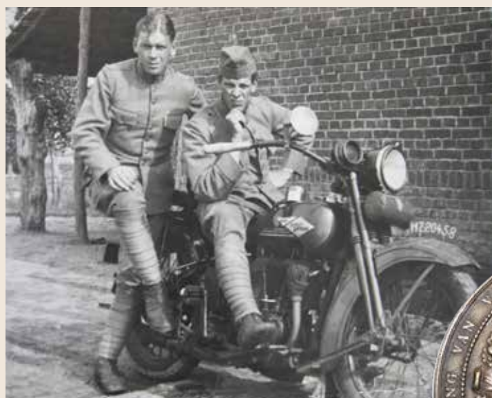
Mijn vader werd in 1939 opgeroepen voor de Mobilisatie

Mijn vader was in de oorlog melkbezorger en accordeonist met schriftelijke toestemming van de Duitse macht. Hij was accordeonist in Café Smeets op de hoek van de Turfmarkt/Nieuwe Haven. Hij speelde eens op een avond met zijn voet op een briefje van 25 gul-