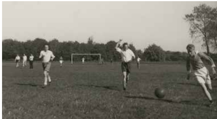
Voetballende jongens in het Zuiderpark. Foto uit 1948

Als katholiek joch zonden mijn ouders mij het Zuiderpark in, naar de 'zwart-roden', de overburen van ADO. Voetbal Vereniging Pancrattus; uitgescholden door onder meer ontevreden supporters van de tegenpartij: Vuller Van Pastoor. Misschien dat Van Dale 'vuller' omschrijft als: vuilnis. Of er 'onsportief' (m.a.w. vuil), door ons werd gespeeld...? Ik vraag het mij af.