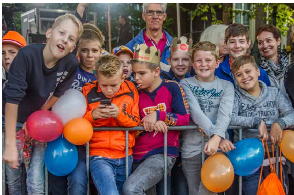
Kinderen achter een dranghek op Prinsjesdag. Foto uit 2017, Harry van Reeken, Haags Gemeentearchief