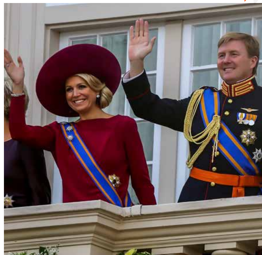
De balkonscène op Prinsjesdag 2012.

opgeheven. In 1866 kregen de weerbaarheidsverenigingen officieel een permanente status. Iedere universiteitsstad kreeg een eigen studentenweerbaarheid, altijd gekoppeld aan het corps. Utrecht en Leiden zijn de oudste verenigingen waarbij het