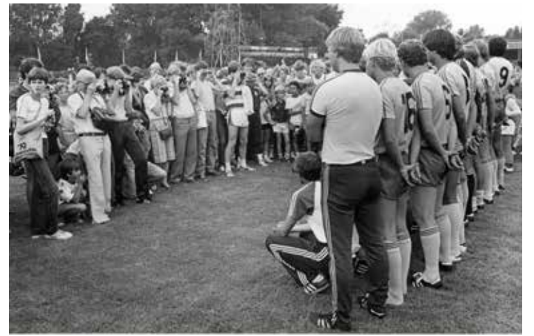
Open Dag bij F.C. Den Haag in het Zuiderpark. Foto uit 1983, Robert Scheers, Haags Gemeentearchief

Een van mijn schoolschriften vulde zich bijna als vanzelf met handtekeningen van bekende voetballers, allereerst van de Haagse 'internationals', want zowel ADO als SHS leverden aan het Nederlands elftal. Hup Holland Hup, laat de Leeuw niet in z'n hempie staan was een hit, bij iedere interland, op ieders lippen. Ene Jan de Cler was de creatieve vader van dit lied, dat tijdens de interland qua tekst vaak moest worden bijgesteld, afhankelijk van de resultaten van de Oranje-voetballers.