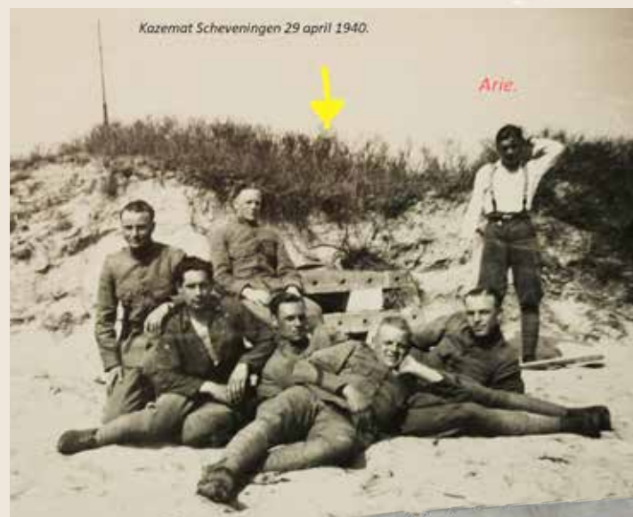
Een Kazemat, een zware bunker aan het Scheveningse strand

Om voor een eigen woning in aanmerking te komen trouwden mijn ouders in mei 1943. Ome Dirk Kuijper (1880) was Postbesteller en had een avondpas tot 22.00 uur en was op de bruiloft op de Houtmarkt de laatste gast, iedereen moest namelijk om 20.00 uur (spertijd) weer thuis zijn. Op 3 maart 1945 bombardeerde de Engelse luchtmacht de woonwijk Bezuidenhout per ongeluk, met als doelwit de strategische bezette verblijf-