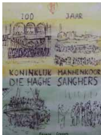
Schets voorkant jubileumboek

Het honderdjarig bestaan was het laatste hoogtepunt, vertelt Aad. Met een jubileumconcert