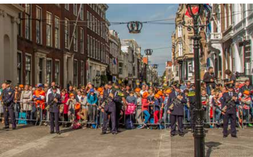
Le op Prinsjesdag. Foto uit 2017, Harry van Reeken, Haags Gemeentearchief

Ton van der Pijl Tonvanderpijl212@gmail.com