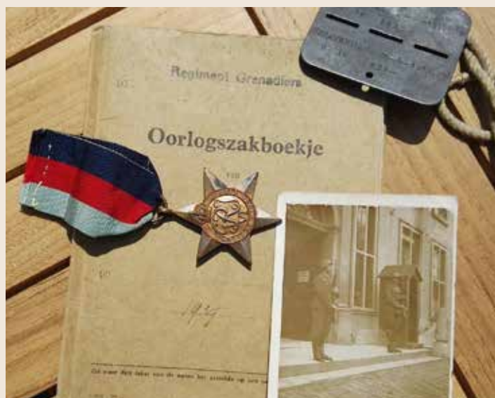
O.a. soldatenboekje en halsplaatje en een foto van het Korte Voorhout huis Nr.7 van twee Duitse wachtsoldaten, stiekem genomen door Zus Kuijper