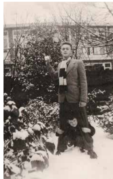
Mijn broertje en ik in de tuin van Mispelstraat 16