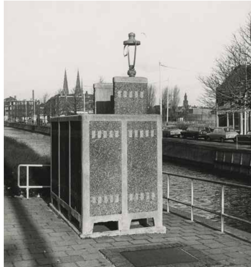
Noord-West-Buitensingel met een urinoir; aan de overkant van het water Bij de Westermolens. Foto uit

Een groep artsen die zeer begaan was met het lot van de cholera patiënten zag wel een relatie tussen de ziekte en de slechte hygiënische omstandig-