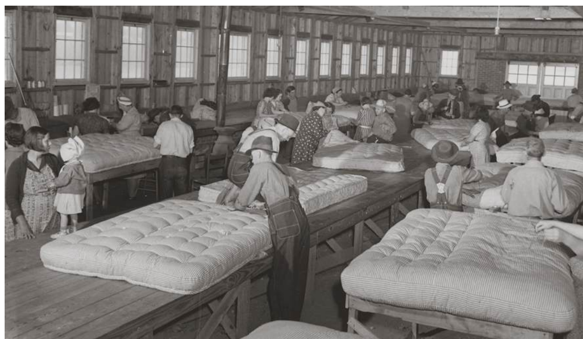
Een matrassenfabriek van vroeger.

In de huidige markt worden vaak chemische stoffen toegevoegd aan matrassen, zogenaamd om de consument te beschermen tegen huisstofmijt, bedwantsen en muggen. Daarnaast worden brandvertragers en synthetische lijmstoffen gebruikt om de veiligheid en duurzaamheid te verhogen. Het