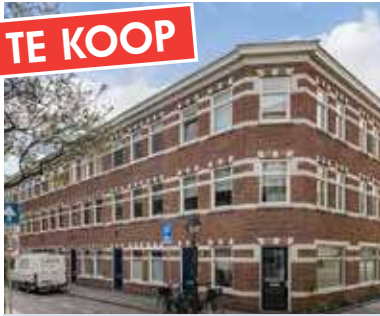
Crispijnstraat 98 € 975.000 k.k.