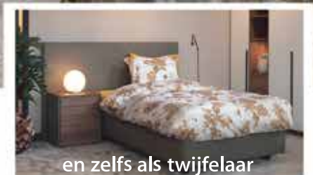
en zelfs als twijfelaar