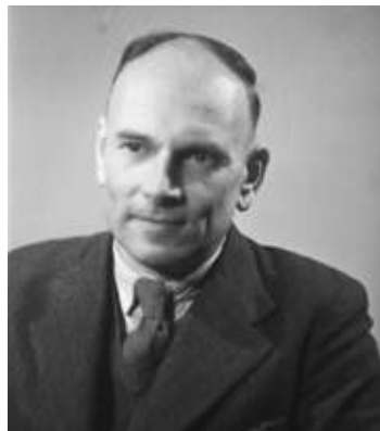
Marinus van der Goes van Naters.