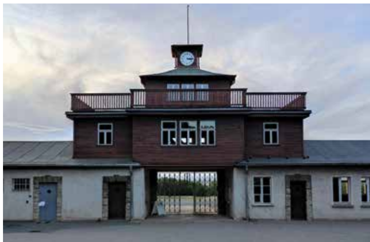
Toegangspoort kamp Buchenwald.