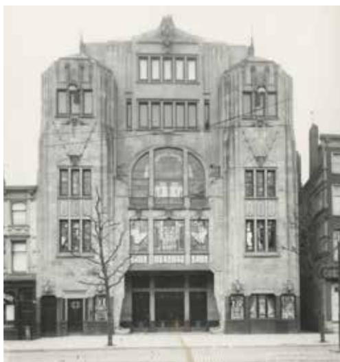
Asta Den Haag rond 1922.