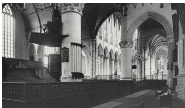
Interieur van de Grote Kerk in de jaren vijftig.