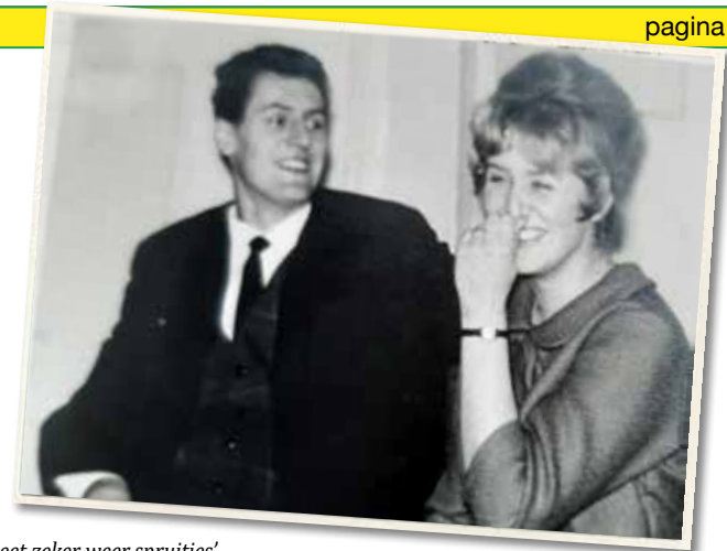
'Oma eet zeker weer spruitjes' Schalkburgerstraat 178 Den Haag