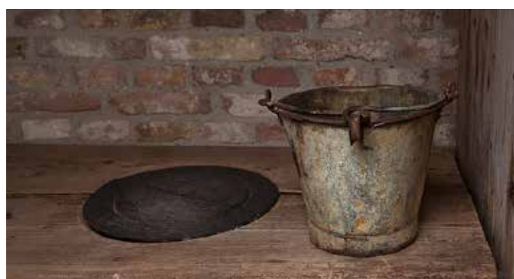
De vroegere poepdoos

Onder invloed van woonprogramma's op televisie is een trend zichtbaar om de wc's steeds luxer uit te voeren. De styling van het sanitair verandert, evenals de kleuren en vormen van de tegels. Er is ook aandacht voor praktische zaken zoals brillen die niet meer met een klap neer kunnen vallen of hangende wc-potten waardoor de vloer makkelijker schoon gemaakt kan worden. Het toppunt van luxe is het Japanse toilet waar de wc-pot is gecombineerd met het bidet. Gaat men op de verwarmde bril zitten dan start automatisch de ventilator die de