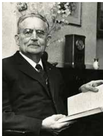
Willem Drees. Foto uit 1965, Stokvis, Haags Gemeentearchief