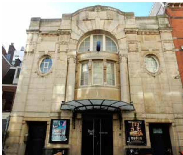
De voormalige Residentiebioscoop in de Kettingstraat