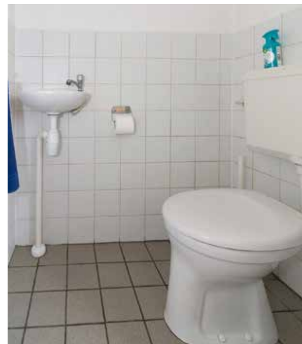
Klassiek moderne wc