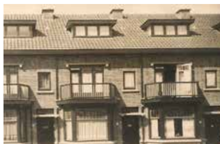
Rechts nr 18 van de Mispelstraat

Gesloten huis , met als ondertitel Zelfportret met ouders (1994). Het spreek van-zelf dat ik het boek nog een keer gelezen heb in verband met het schrijven van dit artikel. Wat moet ik wel en wat niet vertellen, zo vroeg ik mij af. In ieder geval dat jullie het boek moeten gaan lezen. Nicolaas beschrijft hoe hij samen met zijn zus en zijn broer het huis van zijn ouders leeghaalt, nadat eerst zijn vader en jaren later zijn moeder overleden is. Aan het eind schrijft hij: "Ik houd ervan sporen uit te wissen", maar is dat zo? Hij beschrijft tot in de kleinste details hoe dit in z'n werk is gegaan. Hij gebruikt dit leeghalen als kapstok om zijn jeugd te beschrijven, een jeugd die tot op de dag dat hij dit boek schreef - hij was toen bijna vijftig jaar - doorloopt.