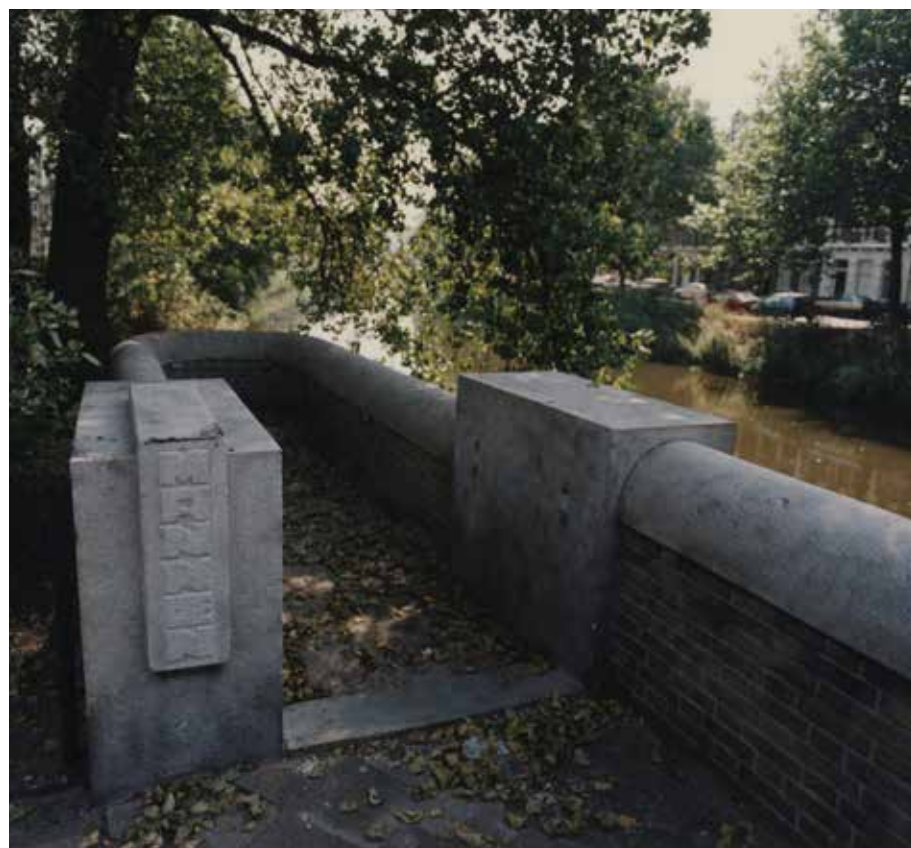
Laan van Meerdervoort hoek Conradkade, toegang tot ondergronds urinoir (dichtgestort).

Plassen op straat was voor mannen de gewoonste zaak van de wereld. Het leverde natuurlijk ook stankoverlast op. Parijs was de eerste grote stad waar dat werd verboden en op grote schaal kwamen er openbare plasgelegenheden, de zogenaamde pissoirs. Den Haag kon niet achter blijven toen het riool was aangelegd. Zij heeft in de loop der jaren verschillende soorten plasgelegenheden gebouwd, van metalen hokjes tot de bekende betonnen huisjes. Het stonk er altijd en de muren waren vol gekalkt met teksten