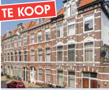
Van Bylandtstraat 101 € 550.000 k.k.