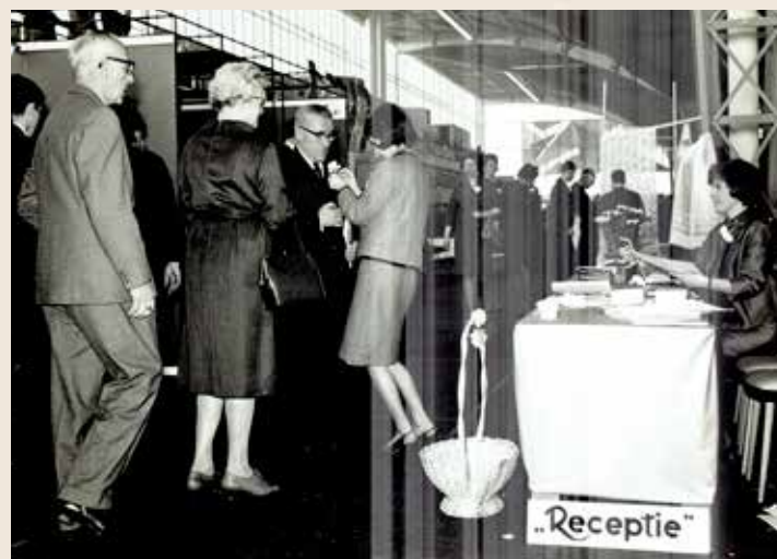
De foto die ik vond van de jubileumbeurs die in 1965 door mijn toenmalige werkgever Ceniko werd georganiseerd