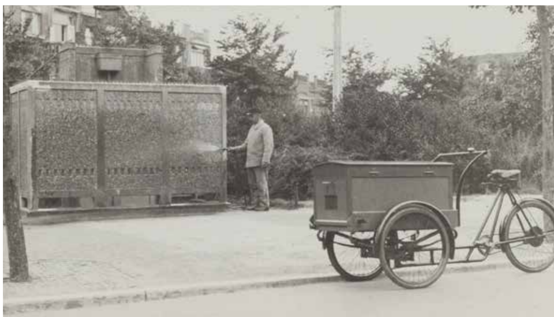
Schoonmaken van een openbare urinoir voor mannen door de Haagsche Reinigingsdienst. Van Boetzelaerlaan westzijde bij de Van Boisotstraat. Foto uit 1930, Haags Gemeentearchief