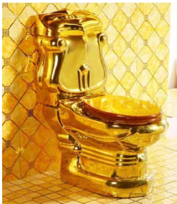
Een gouden wc-pot