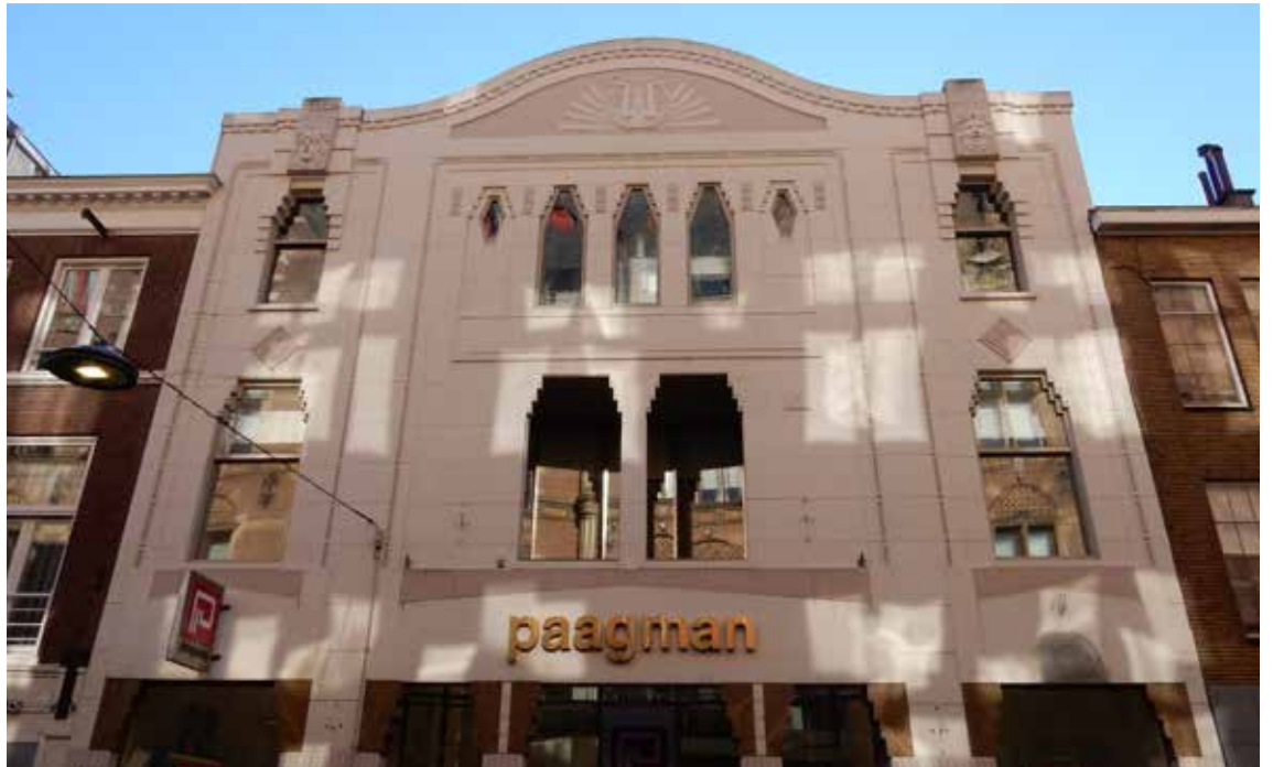
Vroegere bioscoop Rex aan de Lange Poten

In 1912 werd in de Kettingstraat de eerste echte Haagse bioscoop geopend, onder de naam Residentie Bioscoop. Al eerder waren in Den Haag films vertoond, al in 1896 in het Kurhaus, maar