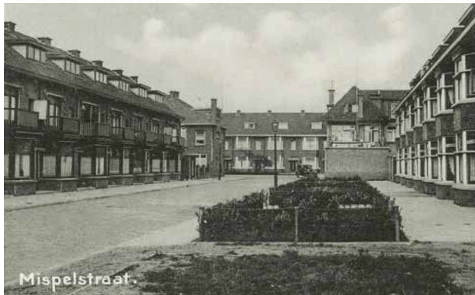
Mispelstraat, gezien ter hoogte van nr. 3 in de richting van de Tomatenstraat. Prentbriefkaart uit 1933