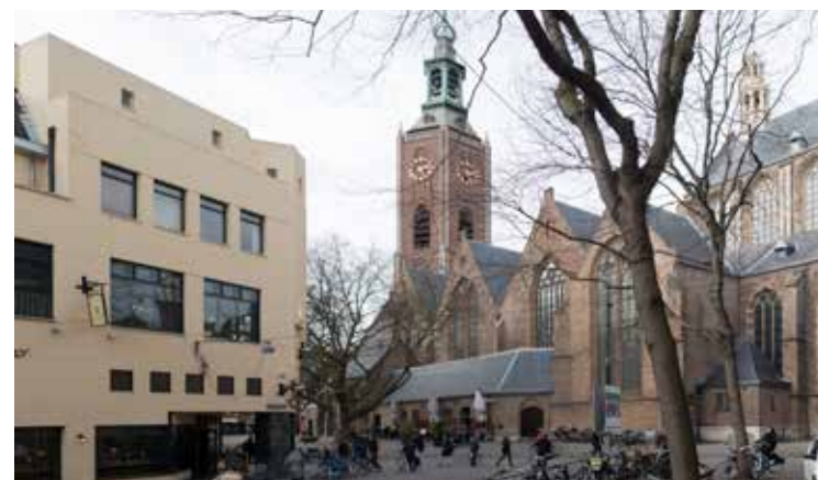
Schoolstraat hoek Rond de Grote Kerk.

Onlangs haalden we herinneringen op aan deze ervaring. Dat doe je zo wel eens op onze leeftijd. We verbaasden ons erover dat er zo respectloos met de stoffelijke resten van onze voorouders was omgesprongen. Nog merkwaardiger was dat er kennelijk geen archeologisch onderzoek gedaan was naar de graven. Want dan zouden de resten goed geordend en geregistreerd herbegraven zijn, zodat toekomstige onderzoe-