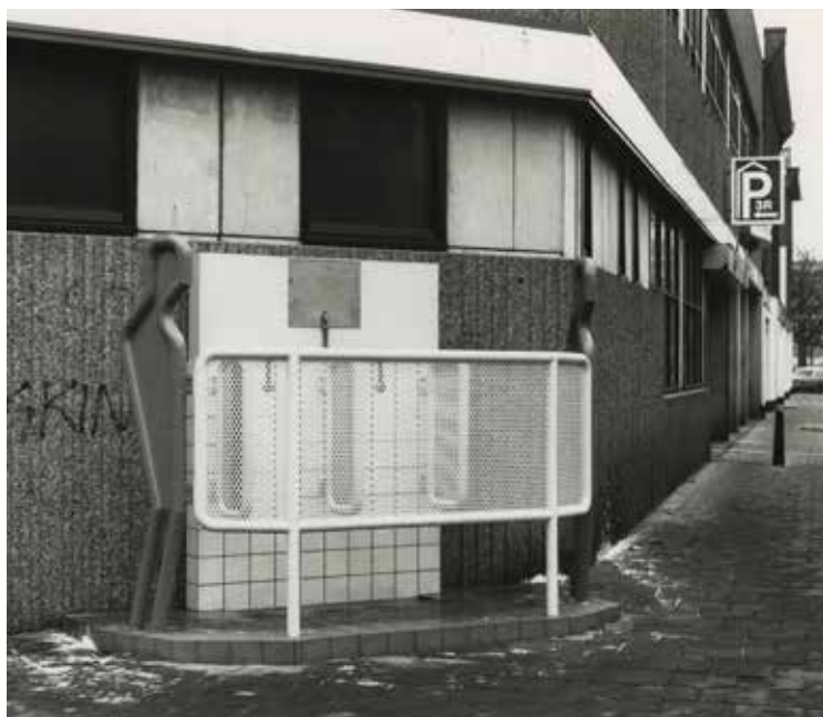
Urinoir in de jaren tachtig, Scheldestraat hoek Geleenstraat.

In de tussentijd hadden de Hygienisten, zoals deze groep werd genoemd, de politiek overtuigd dat riolen aangelegd moesten worden. Londen en Parijs waren ons twintig jaar voor want Nederland had geen ervaring met het in slappe grond aanleggen van zware buizen en pompen. Den Haag koos er daarom voor prioriteit te geven aan de aanleg van lichte drinkwaterleidingen. In 1874 was het zo ver dat de eerste leidingen de grond in gingen. Voor die tijd bestond drinkwater meestal uit opgepompt grondwater. Dat was zwaar vervuild doordat de pomp vaak te dicht bij de beerput zat. Nu brachten de waterleidingen schoon duinwater naar de huizen. Voorrang kregen de arme wijken met de