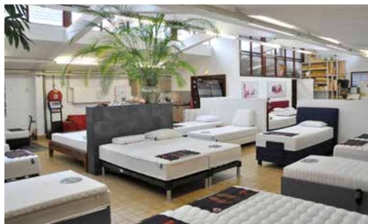
Showroom van de Scheveningse matrassenfabriek

Soetensstraat 18 (zijstraat Stevinstraat) 070-3387010 www.healthfoam.com