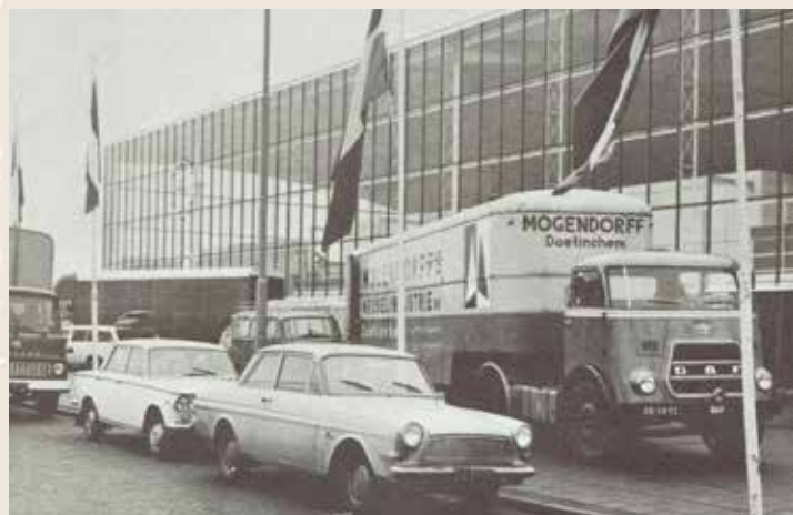
Gooiland, Hilversum in 1965