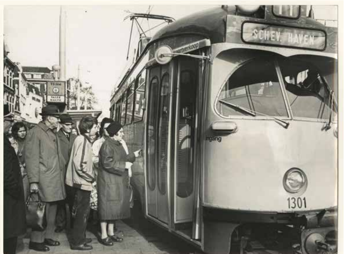
Tramwagen van lijn 11 op het Stationsplein, die ook langs de Herman Costerstraat reed waar wij naar de rommel-vismarkt gingen. Foto uit 1972, Stokvis, Haags Gemeentearchief