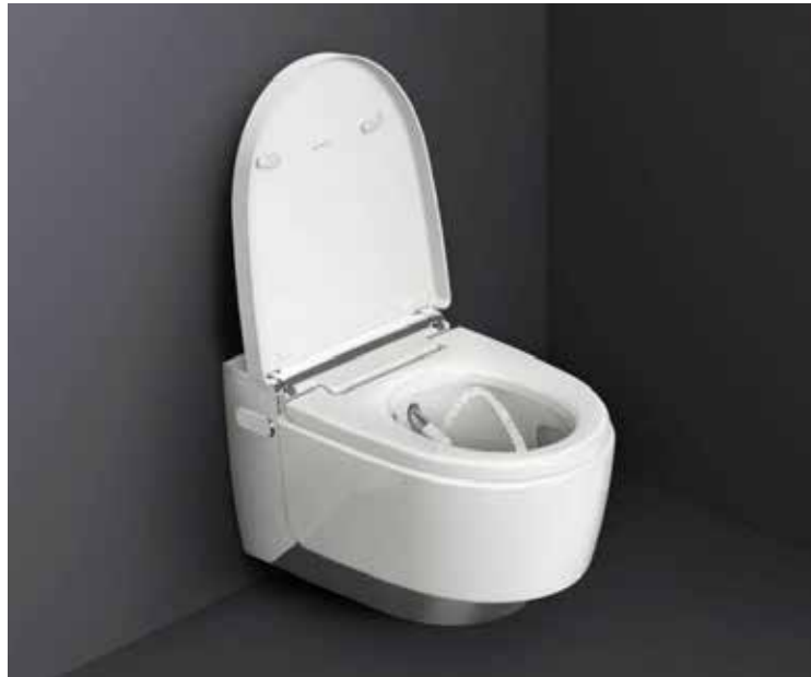
De Japanse wc

In veel hofjes en arme buurten hadden de huizen geen wc maar waren er latrines gemaakt; gemeenschappelijke wc's waar het niet bepaald hygiënisch was en onaangenaam om lang te verblijven. Gevolg was dat er ernstige ziektes uitbraken. In 1832 deed de cholera haar intrede in Nederland en wel in Scheveningen. De ziekte heerste in India en werd door Engelse handelaren meegenomen naar Engeland. Scheveningse vissers die boter naar Engeland smokkelden,