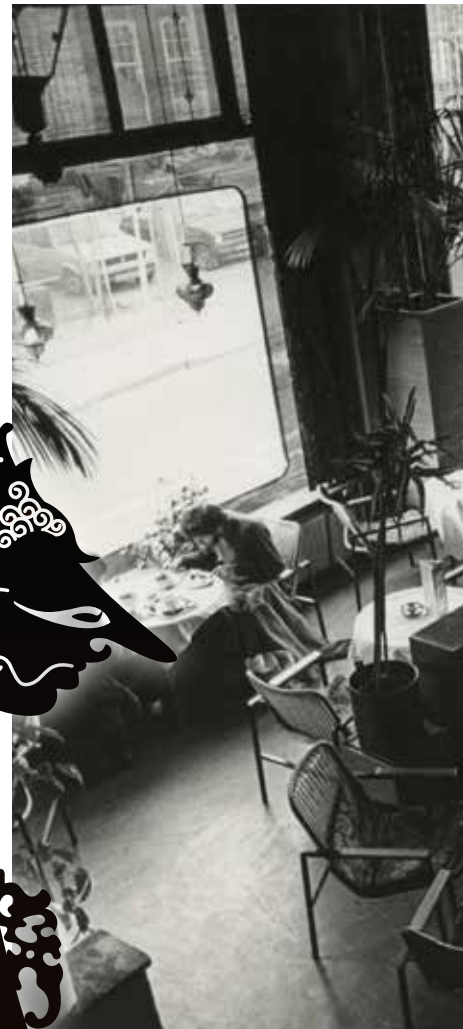
De lounge van restaurant Garoeda in de jaren '50.

Gerenommeerde restaurants als Tapat Senang en Garoeda hielden wat langer het hoofd boven water. Hun klandizie stierf echter langzaam uit en nieuwe klanten bleven weg. Zij begrepen de