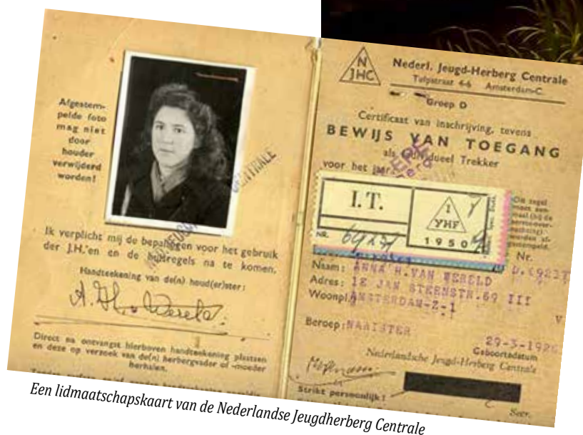
Een lidmaatschapskaart van de Nederlandse Jeugdherberg Centrale

van alles betekenen: mee helpen in de keuken, afwassen, de aardappelen schillen, de bedden opmaken. En er werd van je verwacht dat je de zogenoemde gastouders van de jeugdherberg 'vader en moeder' noemde. Dat laatste was even wennen, maar we slaagden daar snel in.