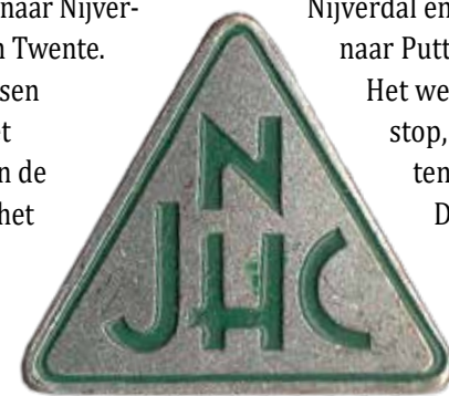
Logo NJHC, Nederlandse Jeugdherberg Centrale