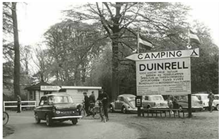
De ingang van Duinrell, 1965