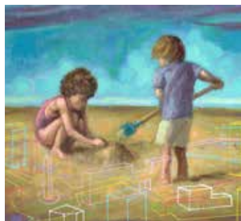
Kleine architecten op het strand door Taco Eisma

Er is geen strand zo charmant, als het Scheveningse strand. - Jacques van Tol