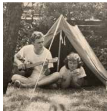
Ik met m'n eerste vriendinnetje