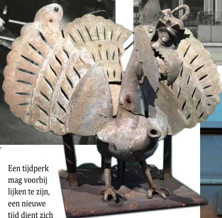
De Garuda die boven de deur van Garoeda stond. Nu tentoongesteld in het Haags Historisch Museum