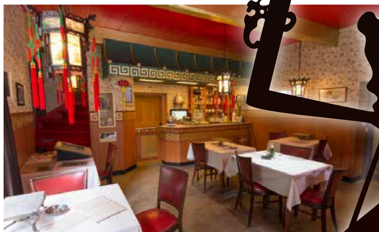
Het interieur van een Chinees restaurant in de jaren '60.

1989 in stand, mede dankzij de livemuziek die daar gespeeld werd. Voor veel kleine restaurants als Ardjoena aan de Groot Hertoginnelaan en Melati aan de Thomsonlaan viel in die jaren het doek.