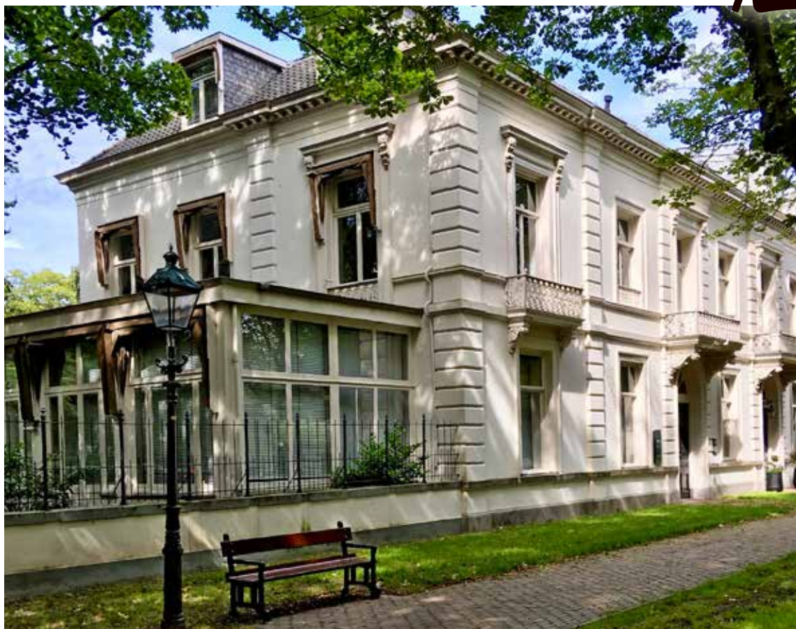
Indisch Herinneringscentrum, op de hoek van Plein 1813 en de Sofialaan.

Gerenommeerde restaurants als Tapat Senang en Garoeda hielden wat langer het hoofd boven water. Hun klandizie stierf echter langzaam uit en nieuwe klanten bleven weg. Zij begrepen de