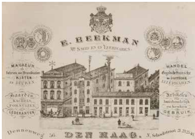
De smidswinkel, de smederij en magazijnen van E. Beekman, ca 1890.

In 1898 liet de firma het pand aan de Denneweg volledig vernieuwen. In de krant de Avondpost van 3 oktober 1898 is hierover de volgende tekst te vinden: "De energieke eigenaar wil zijn zaak tot de eerste op zijn gebied maken en daartoe werd in het voorjaar een aanvang gemaakt met een reusachtige verbouwing, waardoor het kachelmagazijn geworden is tot een inrichting zoals men moeilijk in Nederland en België een tweede zal kunnen aanwijzen. Thans is alles nog niet gereed, toch trekt de fraaie, eigenaardige gevel reeds de aandacht van alle voorbijgangers. Niet minder dan 45.000 kilo ijzer