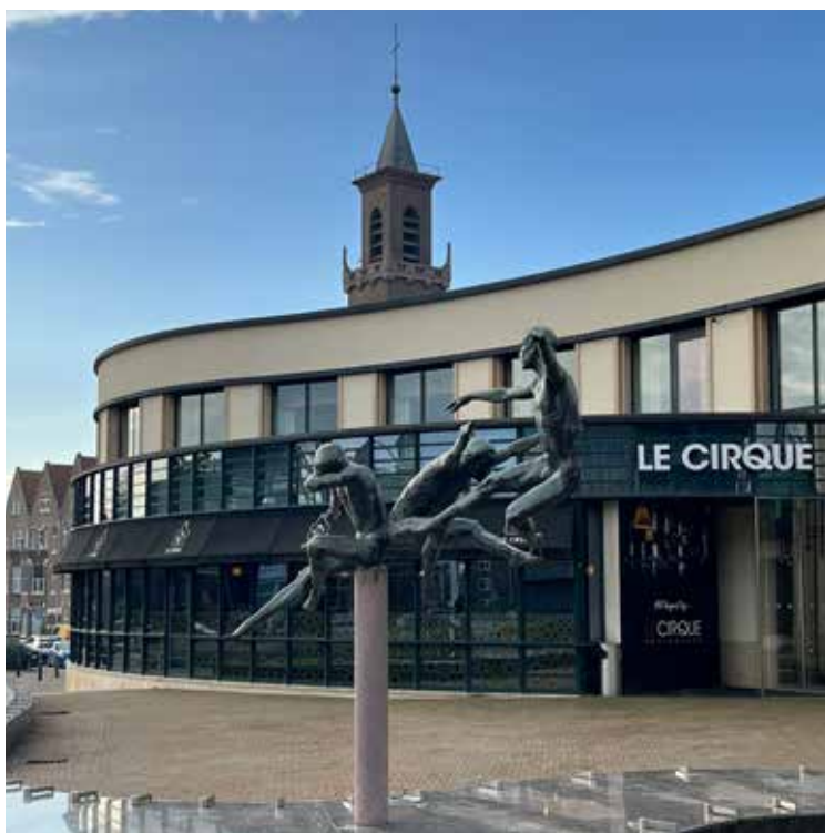
De kerktoeren prijkt uit boven het Circustheater