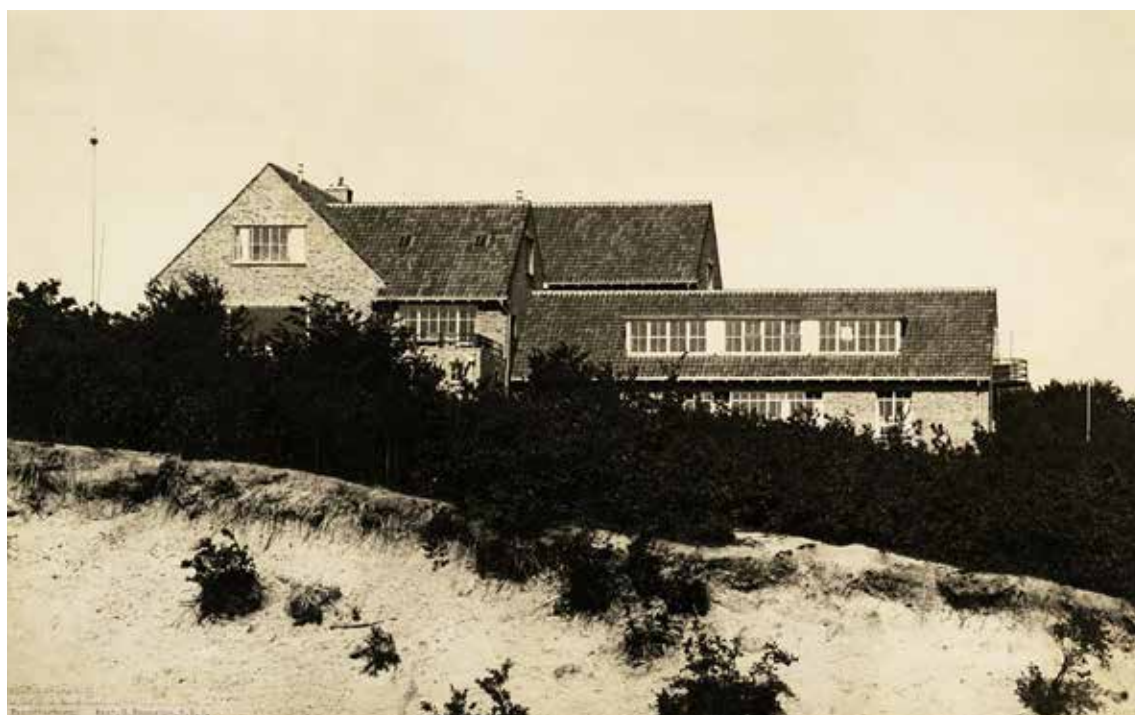
Jeugdherberg Alteveer, Arnhem. Foto uit 1933, NAI Collection, Wikimedia commons