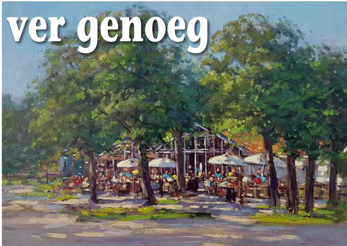
De boerderij Meijndel door Haagse kunstschilder Simon Balyon

achter, zoals in die tijd vaak gebruikelijk was. We gingen dan geld brengen naar mijn oma. Ik heb niemand ooit zo blij zien kijken als mijn oma toen ze vanaf januari 1957 'van Drees trok', zoals dat heette. Ze kreeg voor het eerst AOW, dat wil zeggen €32,45 per maand.