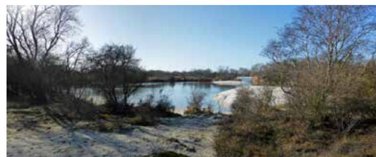
Kijfhoek en Bierlap

stad gekocht. Ik weet nu nog dat dat tentje de Poolster heette. Net genoeg ruimte voor twee personen. Bij Duinrell had je in die tijd nog een uiterst eenvoudig kampeerterreintje. Van 1948 tot 1964 had de Nederlandse Toeristen Kampeer Club (NTKC) op het landgoed Duinrell, rechts van de ingang, een stuk land in gebruik. Hier bevond zich een koudwaterkraan en als ik me goed herinner een houten toilet en verder niets. Ik ging er op de fiets heen en had heel wat mee te zeulen. De NTKC is in 1912 opgericht en is dan ook de oud-