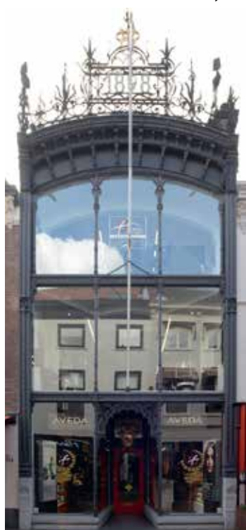
Pand Bosboom aan de Denneweg.