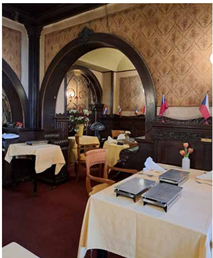
Restaurant Puntjak, het hoekje waar recent Rutte met president Macron heeft geluncht