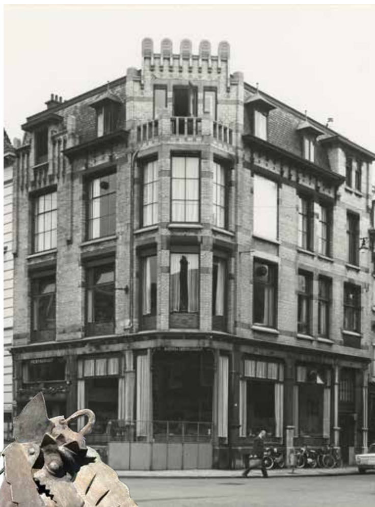
Gevel van Restaurant Garoeda.

Een tijdperk mag voorbij lijken te zijn, een nieuwe tijd dient zich aan. De tweede generatie Indo families stapte meer en meer over op Europese gerechten of ging zelf hun maaltijden bereiden. Dat kon ook steeds makkelijker omdat op veel plaatsen de benodigde ingrediënten te koop kwamen. Menige familie ontdekte de