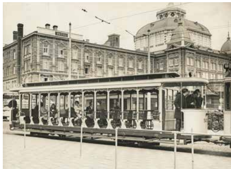
De open tram bij het Kurhaus. Foto uit 1965, Stokvis, Haags Gemeentearchief

Een kakkineuze meeuw uit Wassenaar, die heeft z'n zaakjes voor elkaar. Hij zei tegen z'n maatje: "Ik weet het wel, ik ga binnenkort weer naar Meijndel". - C.D.E.