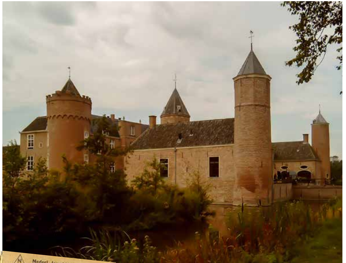
Stayokay in Domburg.