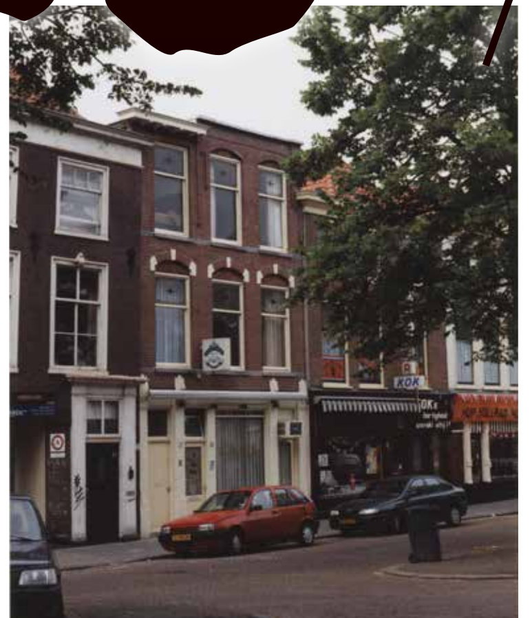
Brouwersgracht 29, Indonesisch restaurant Soeboer.