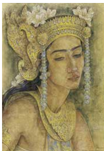
Rudolf Bonnet (1895-1987) Devi Sita / Goddess Sita Hamerprijs: € 70.000 Verkocht tijdens de Indonesian Art Sale 18 november 2020