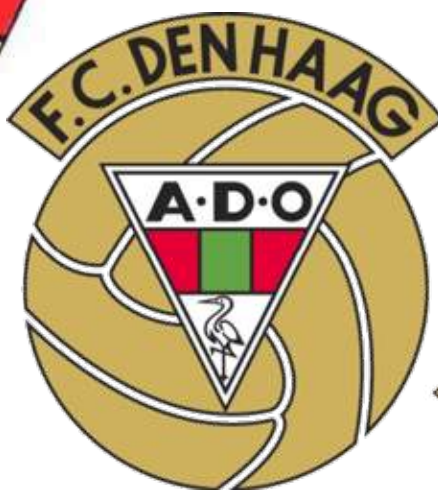
FC Den Haag logo 1971-1976

Het uit volle borst meezingen met het Haagse volkslied van Harrie Jekkers. Juichen als onze helden opkomen en de wedstrijd