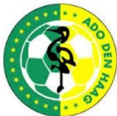
ADO Den Haag logo 1994-2004

redenen hoogte- en dieptepunten. Na jarenlang op verschillende (gast-)velden te hebben gespeeld, krijgt de club een eeuw geleden in 1925 een eigen voetbalstadion in het Zuiderpark, waar grote successen behaald zouden worden. Landskampioen in 1942 en 1943. Bekerwinnaar in 1968 en 1975. Kampioen eerste divisie in 1957, 1986 en 2003. In 1971 verandert de naam door de fusie