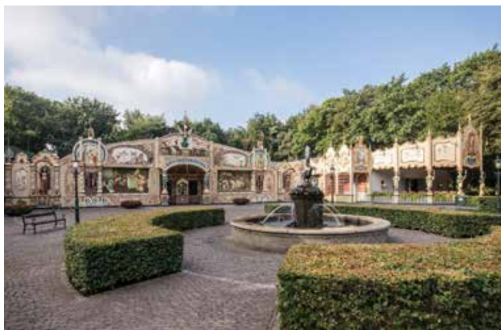
De Carrousel.

Veertien dagen lang, van 5 tot 20 oktober 1946, stond Den Haag in het teken van Onze Marine. In verschillende bioscopen draaiden Marinefilms. De Haagse schooljeugd bezocht schepen in de Scheveningse haven en door Den Haag reed een R.E.T. tram, opgetuigd als de Nieuw Amsterdam. Op het strand van Scheveningen was een gekostumeerd Neptunusfeest. Middelpunt van het evenement was het Malieveld. Daar werd in een betrekkelijk korte periode een groots opgezette maritieme tentoonstelling ingericht en een uitgebreid lunapark opgebouwd. Zo werd het nuttige (de tentoonstelling) gecombineerd met het aangename (het lunapark). De tentoonstelling gaf een uitgebreid overzicht van wat Nederland presteerde op scheepvaartgebied. Er waren diorama's, scheepsmodellen, affiches etc. Tevens kon men souvenirs en boeken kopen of zich als lid aanmelden. Het lunapark, dat alleen via de tentoonstelling kon worden bereikt, bevatte alle 'heerlijkheden' die men van een kermis kon verwachten. Op het Malieveld stonden ruim tachtig kermisvermakelijkheden, zoals