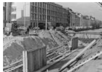
Koninginnegracht in 1968