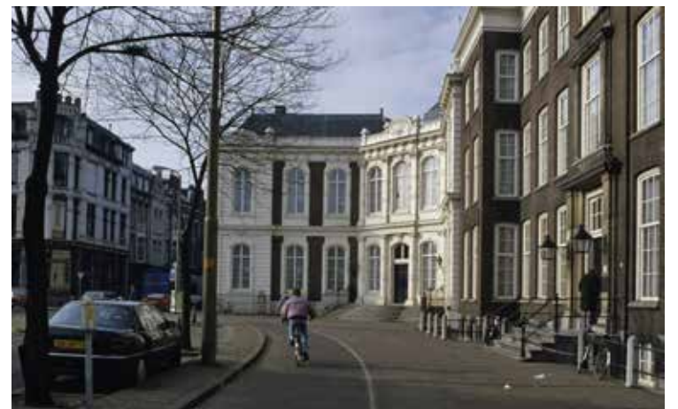
Paleis Kneuterdijk.