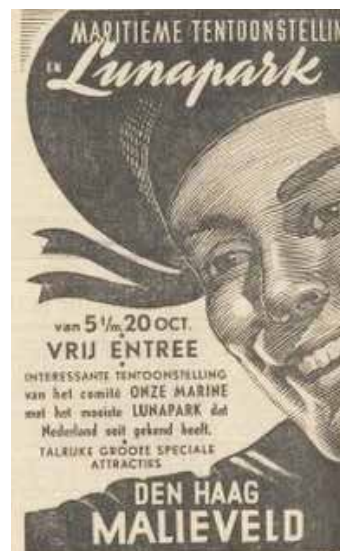
Advertentie in Het Binnenhof, 4 oktober 1946

De tentoonstelling en het lunapark trokken ruim 800.000 bezoekers. Hoeveel zij hebben bijgedragen in bouwkosten van het propagandaschip heb ik niet kunnen achterhalen. Op 4 juni 1947 werd de VanderSteng te water gelaten. Bijna vijf jaar doorkruiste het schip de Nederlandse wateren en deed tijdens de Watersnoodramp dienst als hospitaalschip. Maar de geraamde bouwkosten waren met tweehonderdvijftigduizend gulden overschreden en het aantal leden daalde, zodat de kosten steeds zwaarder op Onze Marine gingen drukken. Rond 1954 werd het schip, met verlies, verkocht aan een Italiaanse rederij. Waarschijnlijk is het schip - omgebouwd tot motorjacht - nog steeds in de vaart.