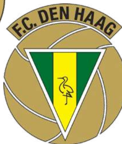
FC Den Haag logo 1976-1992

Als het balletje eenmaal rolde, werden de grenzen van het toelaatbare opgerekt. Er werd pas geluisterd als moeder voor de tiende keer uit het raam schreeuwde dat het avondeten op tafel stond. Met regelmaat kwam je te laat thuis of op school omdat je nog een fraaie actie wilde maken. Soms sneuvelde een ruit als een bal loeihard uit de bocht vloog. De ergste straf die je kon krijgen, was thuisblijven waardoor je niet kon voetballen. Schaafwonden, blauwe plekken, vuile kapotte kleding en schoenen waren geen uitzondering. Maar als de bal eenmaal weer rolde dan was alles snel vergeten.