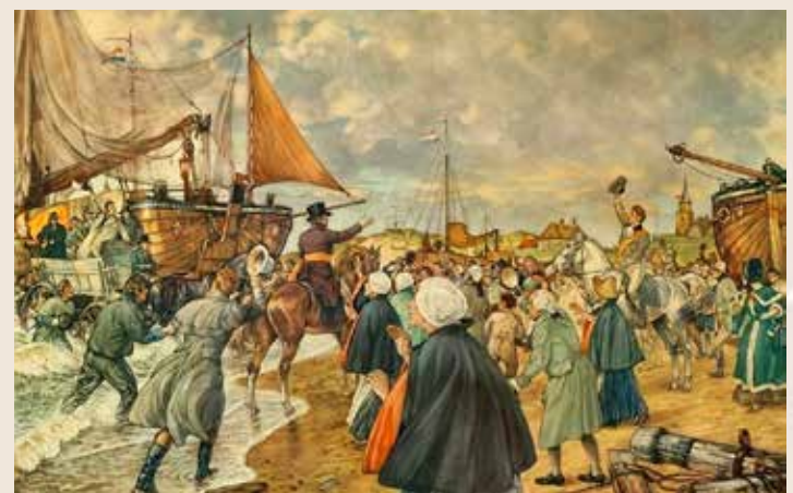
Aankomst van Willem I te Scheveningen in 1813. Schoolplaat van J.H. Isings