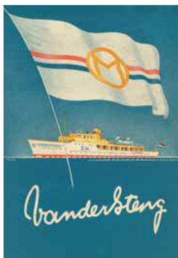
Omslag gedenkboek VanderSteng, 1947

Het schip kreeg de naam 'Vandersteng'. Dit was een verwijzing naar het hoofdpersoonage uit een destijds populaire reeks boekjes over matroos eerste klasse Van der Steng, die symbolisch het Nederlandse zeevolk vertegenwoordigde. Direct na de oorlog vond de kiellegging plaats op de scheepswerf van Wilton-Feijenoord. De kosten werden geraamd op ruim een miljoen gulden. De helft van de bouwkosten nam het bedrijfsleven voor haar rekening door het belangeloos leveren van materialen en arbeidskrachten. Zo werd het schip gratis ingericht, van linoleum tot de bar, van de filmzaal tot de reddingsboeien en van de