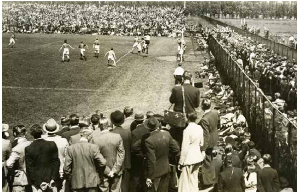
Wedstrijd om het voetbalkampioenschap van Nederland op het ADO-terrein in het Zuiderpark, 1942.

Op de tribune ontstaat de verbroedering. Supporters in allerlei soorten en maten. Hagenezen en Hagenaars. Jong en oud. Man en vrouw. Wit en zwart. Hoog en laag opgeleid. Hetero en homo. Atheïst en gelovig. Zittend en staand. Rustig