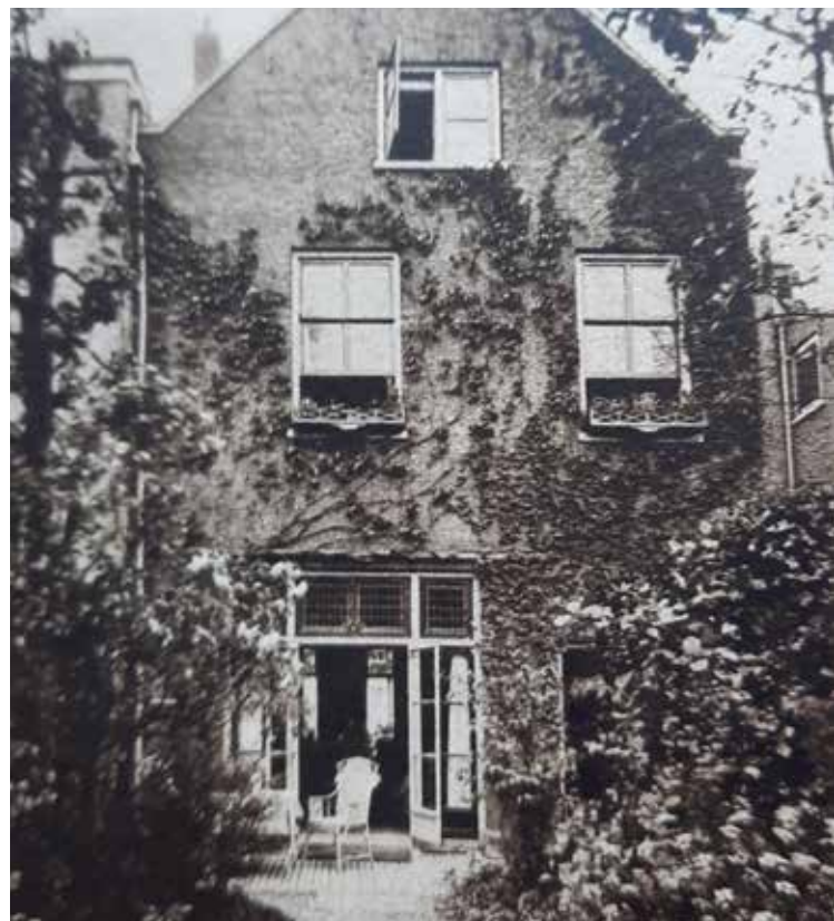
Het geboortehuis van Antonie in de Tullinghstraat