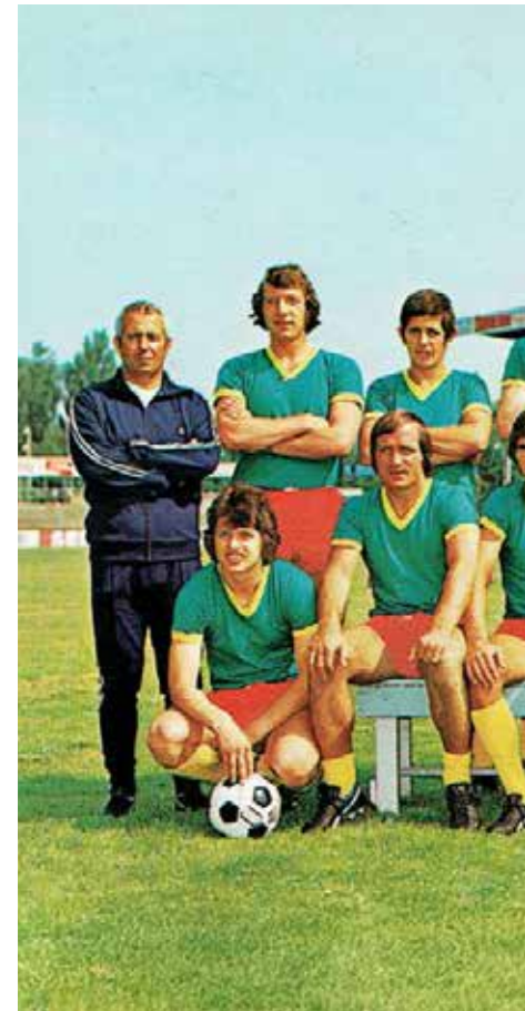
FC Den Haag 1972-1973

puter of games. Het gebeurde buiten. Een bal en wat jassen als doel en de pret kon beginnen. Ook een blinde muur voldeed. Iedere minuut werd benut. Op vrije dagen maar ook voor en na schooltijd. In de pauze werd het brood snel naar binnen gewerkt omdat de straat lonkte.