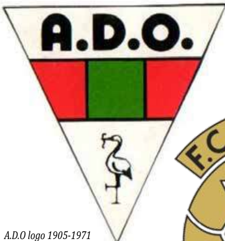
A.D.O logo 1905-1971

en fanatiek. We zoeken elkaar op. Samen met een drankje en een warme worst genieten van de geweldige stemming. Slap ouwehoeren over de laatste stand van zaken. Proosten op een goede afloop. Kippenvel als een zieke supporter gesteund wordt en overledenen herdacht. In je handen klappen als de opstelling bekend wordt gemaakt.