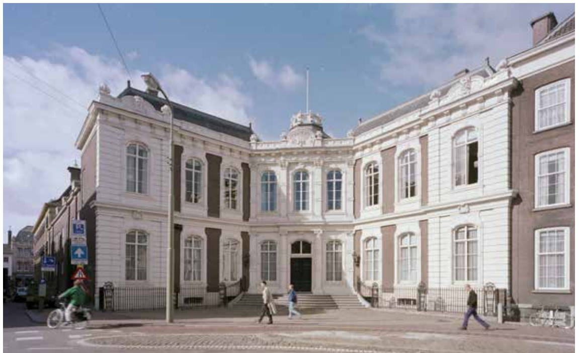
Paleis Kneuterdijk.

Willem II schonk als huwelijks-cadeau. De jonge kroonprins ging daar met zijn vrouw Anna Paulowna wonen, maar pas nadat het ingrijpend was verbouwd. Anna Paulowna was het als dochter van tsaar Paul I van Rusland luxer gewend. Dat was reden om het pand ingrijpend te verbouwen en te verfraaien. Er kwam een balzaal met witmarmeren zuilen, de Witte zaal, en de vertrekken werden naar de smaak van die tijd aangepast. Toen Willem II werd ingehuldigd als koning liet hij het paleisje wederom verbouwen. Er kwamen gebouwen bij, evenals een grote