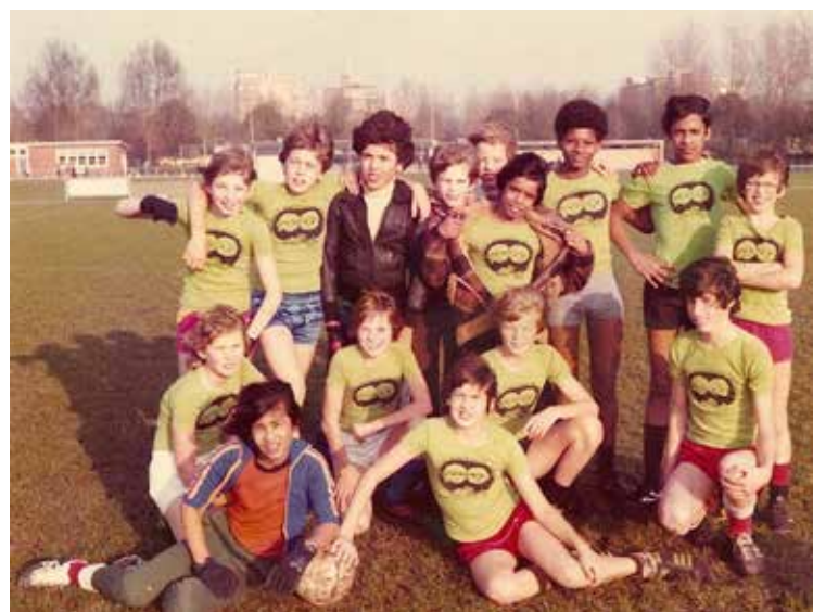
Het schoolvoetbal elftal in 1979. Ik sta als tweede van links, met de blauwe broek, 12 jaar

de jeugd uit de lagere klasse meer ruimte kreeg voor leuke vrijetijdsactiviteiten. De jongens kozen al snel voor voetbal, dat toen bij gebrek aan geschikte verenigingen en terreinen voornamelijk op de openbare weg werd beoefend. Straatvoetbal bleef ook generaties daarna populair. Veel lezers (her-)kennen het wel. Lekker op straat met vriendjes voetballen. Geen verlokkingen als televisie, com-