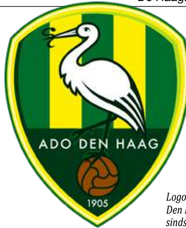
Logo ADO Den Haag sinds 2004

Het begon allemaal begin twintigste eeuw. Den Haag was toen met landskampioenen HVV en