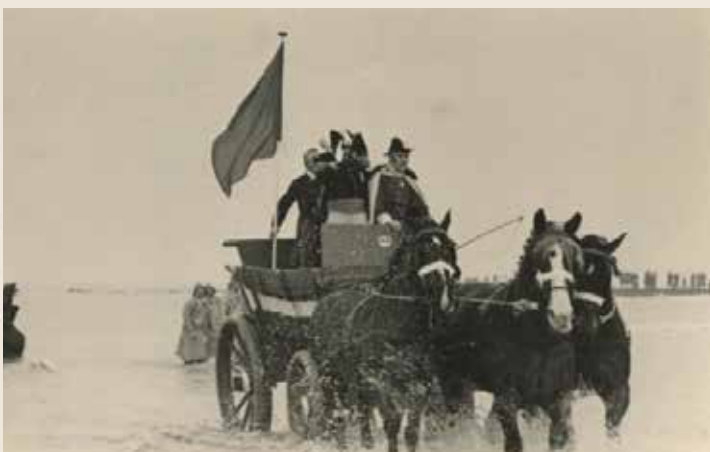
Viering 125 jaar onafhankelijkheid en de nagespeelde landing van de Prins van Oranje in Scheveningen. Foto uit 1938, S. Oppelaar, Haags Gemeentearchief