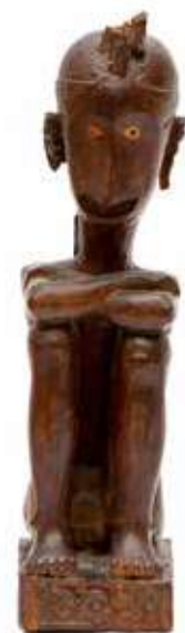
Moluccas, Leti, ancestor figure Hamerprijs: € 16.000 Verkocht tijdens de Indonesian Art Sale 19 november 2020

Over Venduehuis Den Haag Venduehuis Den Haag, opgericht in 1811, is het oudste veilinghuis van Nederland en staat internationaal bekend om zijn brede en hoogwaardige aanbod van kunst, antiek en exclusieve sieraden. Het veilinghuis biedt zowel particulieren als instellingen de mogelijkheid om bijzondere objecten te ontdekken en te verhandelen.