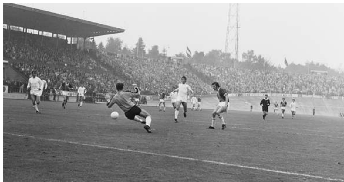
NEC-ADO Den Haag 1-2. Schoenmaker scoort, 18 oktober 1970.

verzamenen zich een twintigtal jongens in café het Hof van Berlijn, eigendom van de vader van Jan, aan de Papestraat waar nu muziekcafé de Paap is gevestigd. Boven de zaak, op nummer 32, woont de familie van Gulik. Op die avond, in de woonkamer, wordt geschiedenis geschreven. De bijeengekomen jongens richten een voetbalvereniging op. Met een blik op de toekomst krijgt de club de naam Alles