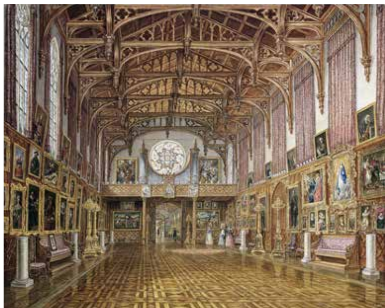
Interieur van de Gotische zaal in Paleis Kneuterdijk. Prent uit 1846