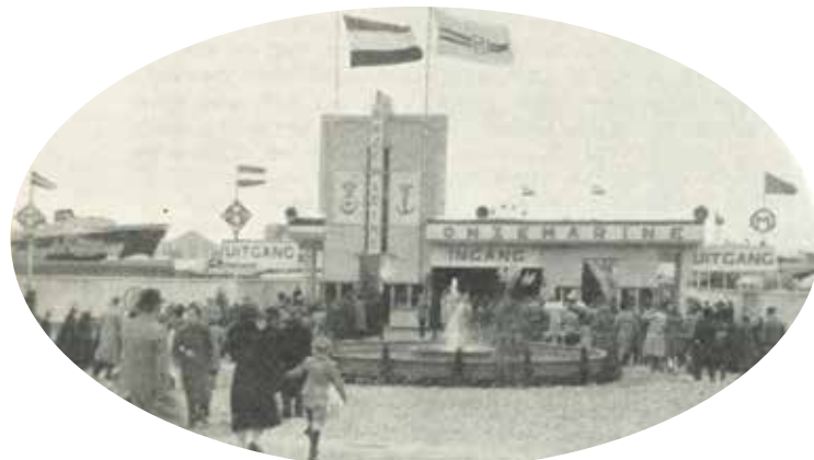
Entree tentoonstelling bij dag, uit maandblad Onze Marine, 1946

badkamers tot de radio-installatie. Het resterende half miljoen hoopte het comité door middel van acties binnen te halen. Een van deze acties was - in oktober 1946 - de organisatie van een maritiem evenement in Den Haag.