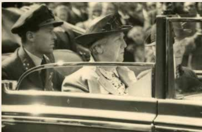
Intocht van koningin Wilhelmina in 1945 met adjudant E. Hazelhoff-Roelfzema.