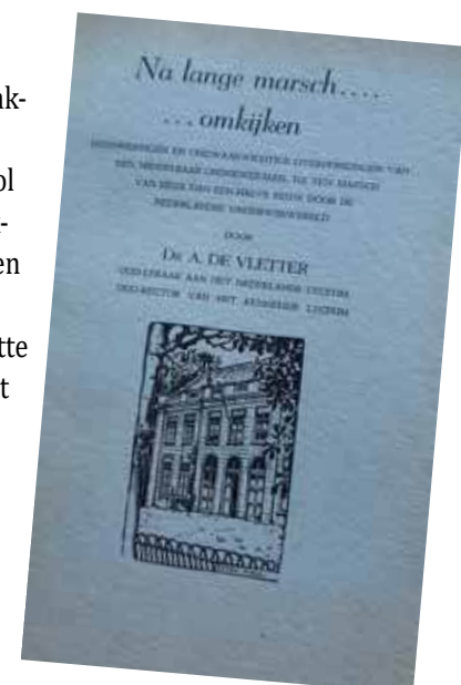
Na lange marsch ... omkijken