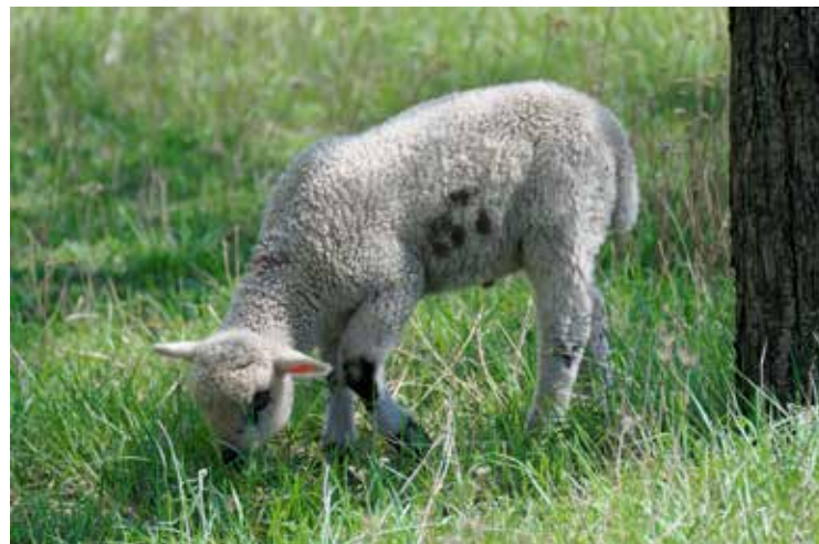
Lammetjes in de wei.

ooievaar terug van zijn reis naar Zuid-Spanje of West-Afrika. Ongelooflijk wat voor afstanden die vogels afleggen om de koude en natte Hollandse winters te ontlopen. Spaanse overwinteraars in Malaga en Marbella kennen waarschijnlijk de grote groepen ooievaars die buiten de stad in de lucht rondcirkelen boven de vuilstortplaatsen. Zij zijn ook te vinden bij de moerassen iets westelijker, waar zij wel concurrentie hebben van andere trekvogelsoorten.