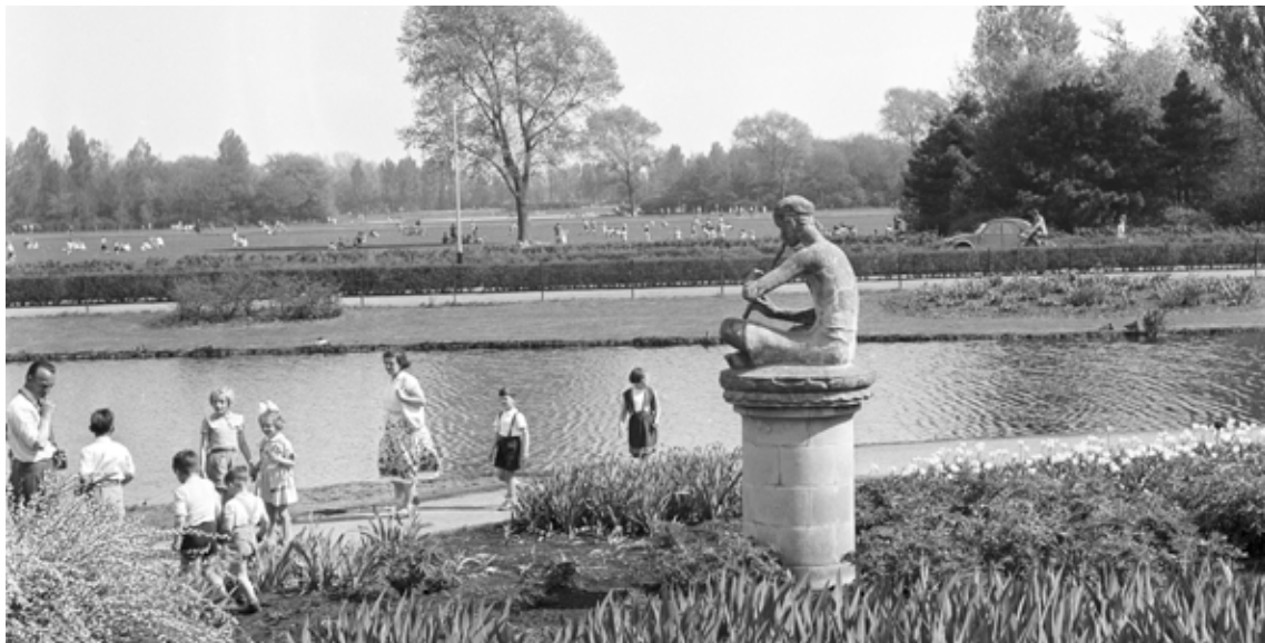
Een mooie lentedag in het Zuiderpark. Foto uit 1951, JosPé, Haags Gemeentearchief

Met dat fietsje begonnen overigens ook mijn eerste avonturen. Op het Zuiderpark was je natuurlijk op den duur uitgekeken. Later, toen ik 'groter' was en de eerste verkering zich aandiende, was het Zuiderpark weer een vanzelfsprekende uitwijklocatie (op het bankje bij de eendenvijver bijvoorbeeld),