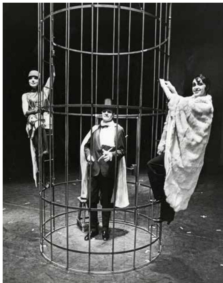
De Haagse Comedie geeft de première van 'Driestuiversopera' (Brecht en Weill) in de Koninklijke Schouwburg. Foto uit 1981, Robert Scheers, Haags Gemeentearchief