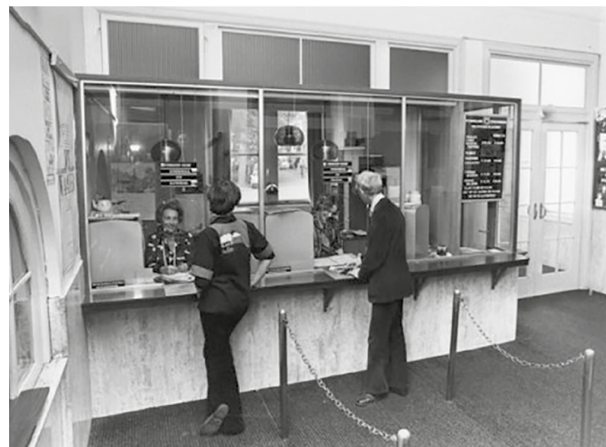
Interieur met kassa