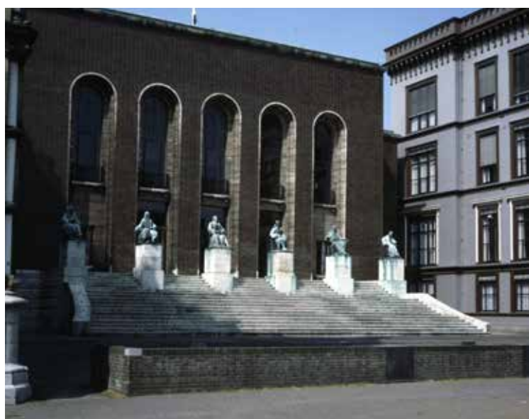
Plein 2, gebouw van de Hoge Raad.

soms weken van tevoren een kaartje kopen, maar dat deed ik graag. Ik was diep onder de indruk toen Paul Steenbergen in het drama Arme Bitos heuse tranen huilde in zijn rol van Bitos. Ik zag ook De vrolijke vrouwtjes van Windsor van Shakespeare en De Kersentuin van Anton Tsjechov, evenals Oom Wanja . Met iedere voorstelling groeide mijn liefde voor het toneel. Er kwamen boven die uitsmijter zoveel herinneringen boven aan de prachtige rollen van Ida Wasserman en de onvergetelijke vertolking van Albert van Dalsum als stokoude bediende.