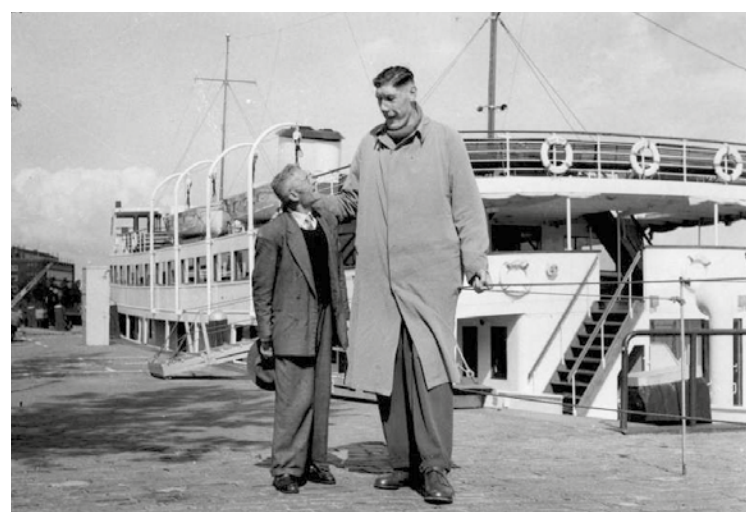
De reus van Rotterdam.

Hetgeen we deden: langs Leiden, Lisse en Sassenheim kwamen we bij het vliegveld aan waar we op een zijweg de dalende en vertrekkende toestellen konden zien. De terugweg verliep echter problematisch; we raakten de weg kwijt en belden in pure wanhoop aan bij een boerderij. Deze man