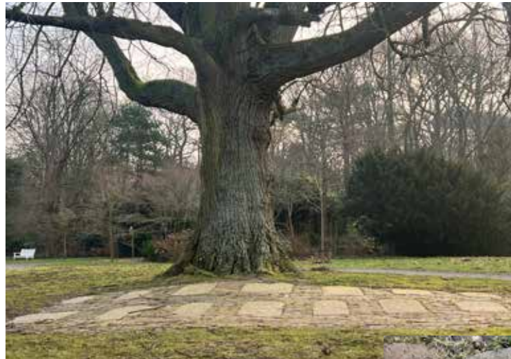
De grafstenen aan de voet van de oude lindeboom