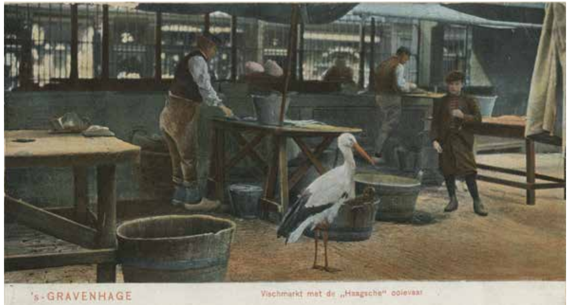
Visbanken met de Haagse ooievaar in de Schoolstraat. Foto uit 1905, Haags Gemeentearchief

Inmiddels geldt dit voor bijna 20% van de in Nederland broedende paren. Dit is echter niet nieuw. In de achttiende en negentiende eeuw werden in Den Haag ooievaars gekortwiekt om op de Vismarkt te helpen