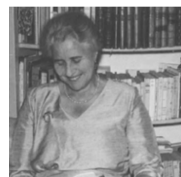
Een foto uit de jaren vijftig.

steeds gelezen en van al die anderen niet. Wel is het zo dat Kitty voortborduurde op het patroon van de schrijfster uit de generatie voor haar en dat zou een reden kunnen zijn. Ze zou de aansluiting met de moderne tijd gemist hebben, wat we hier ook onder moeten verstaan. Wie weet bent u nieuwsgierig geworden en gaat u na lezing van dit artikel op zoek naar een