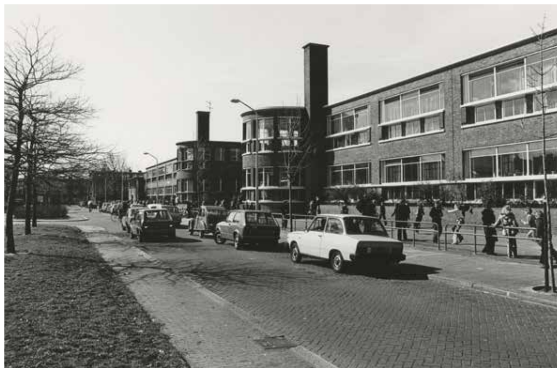
Lagere school aan de Nijkerklaan. Foto uit 1978, P.G. Kempff, Haags Gemeentearchief

Ton van Rijswijk avanrijswijk@kpnmail.nl