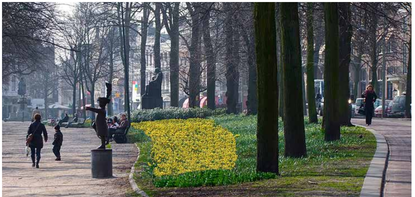
Vijverberg in het voorjaar. Foto uit 2011, Roel Wijnants, Flickr

Het voorjaar is al meer dan zoet verwachten: het is geluk, zo duizeldiep en wijd, dat ogen, oren, handen, mond, gedachten, het leven speuren in zijn heerlijkheid.