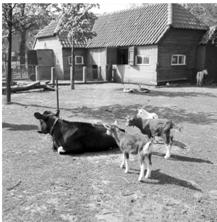
De kinderboerderij in het Zuiderpark. Foto uit 1950, JosPé, Haags Gemeentearchief

Laat ik omschrijven wat die toko nu eigenlijk voorstelde. Het was in de eerste plaats een snoepwinkel, waar je als scholier van je destijds uitermate schamele zakgeld lekkernijen kon kopen, zoals duimdrop en spekkies. Bedenk het maar en ze verkochten het daar. Maar als scholier in de jaren 1950-1956 waren je budgettaire mogelijkheden nog uitermate beperkt. Eén gulden zakgeld per week was een forse uitschieter. Rijk waren mijn ouders niet bepaald; pa had een baan als ambtenaar bij het Arbeidsbureau, maar bereikte nooit het niveau van de topverdieners. De hele wijk had gemiddeld een matig inkomen; er woonden arbeiders, politieagenten en veel ambtenaren. Een nette wijk, maar als kind een eigen fiets bezitten, nee, dat zat er niet in. Zelfs de kleding werd op afbetaling gekocht, heel vaak bij de Emka op het Regentesseplein. Ik had geen eigen fiets dus, die kwam veel later pas toen ik naar de middelbare school ging. Daarvoor moest ik