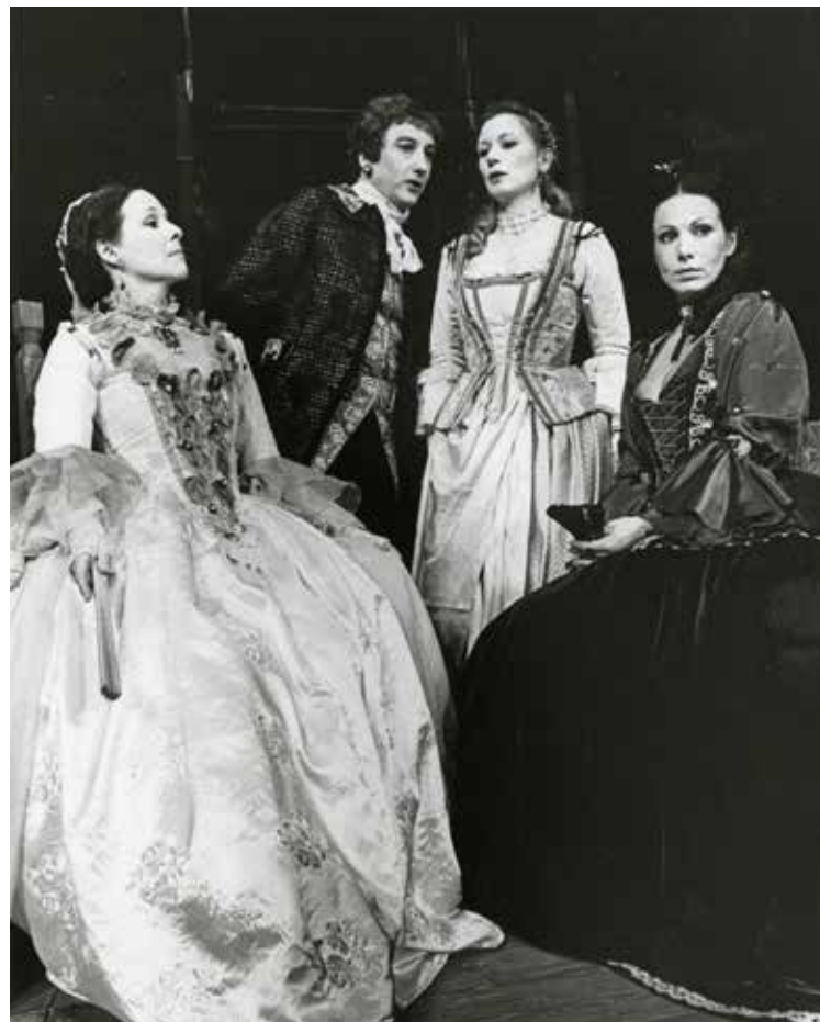
De Haagse Comedie geeft de première van 'Een van de laatste dagen van het Carnaval' (Carlo Goldini) in de Koninklijke Schouwburg.

Ik keek nieuwsgierig om me heen, zoekend naar herkenning en wat ik zag deed me plezier. “Alsof ik thuiskom”, zei ik met een glimlach tegen Maria. Ik bleef even stilstaan bij de portretten van bekende acteurs aan