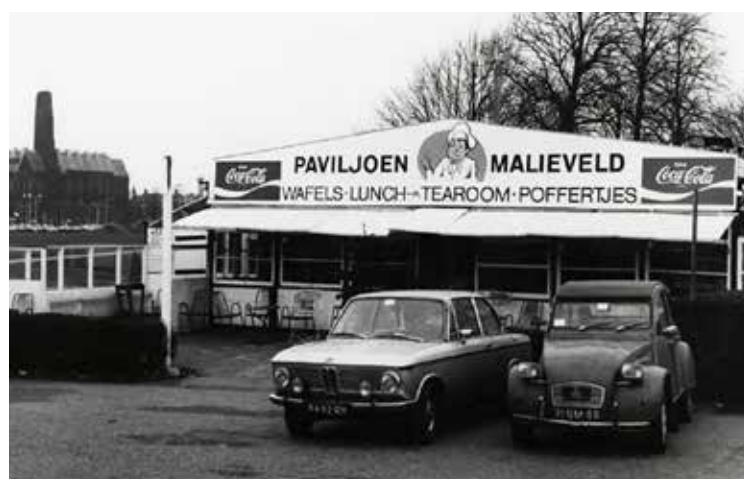
Koekamplaan, Paviljoen Malievelde. Foto uit 1977, Jan Stegeman, Haags Gemeentearchief

immers in zijn oude staat worden bewaard. Maar goed, de indrukwekkende figuren voor de Hoge Raad stonden er nog en gaven de stad de grandeur en het belang als regeringsstad. Dat vervulde me met trots.