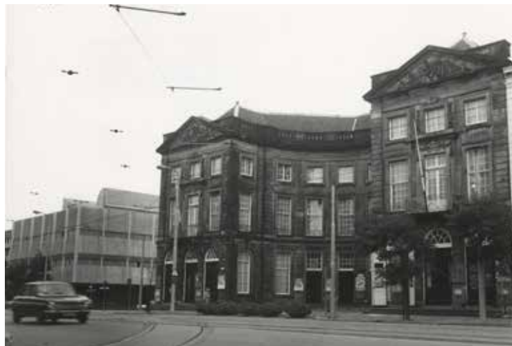
Korte Voorhout, de Koninklijke Schouwburg. Foto uit 1975, Jan Stegeman, Haags Gemeentearchief

De poffertjeskraam, ook wel bekend als het Paviljoen Malievelde, stond er nog steeds. Ik wist niet zeker of er veel was veranderd, maar mijn aandacht werd meteen getrokken door een lijst uitsmijters op de menukaart. Dat was een onverwacht genoeg, want ik had in wel zestig jaar geen uitsmijter meer gegeten. Terwijl we genoten van de uitsmijter en de poffertjes gingen mijn gedachten terug naar mijn bezoeken aan de schouwburg in de jaren zestig. In 1960 had ik van mijn broer kaartjes voor de voorstelling Hendrik V van Shakespeare gekregen en ik ging er samen met een neef naartoe. Ik dacht