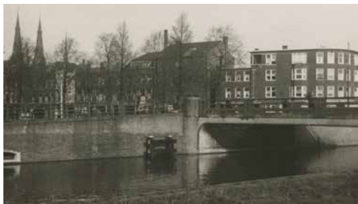
Koningin Emmaplein met de Waldeck Pyrmontkade. Foto uit 1940, H.A.W. Douwes, Haags Gemeentearchief

wat uiteindelijk niet doorging. De toenmalige bewoners (afkomstig van het kraakpand de Blauwe aanslag aan het Buitenom) kochten het op en verbouwden het geheel om tot bovengenoemde woningen en bedrijven. Een iconisch pand gered!