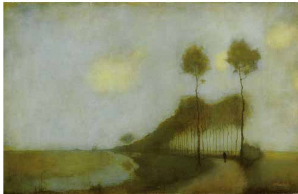
Woudsterweg bij Oranjewoud 1912, uit het boek Jan Mankes, uitgeverij Waanders b.v. Zwolle 2007

Laat ik beginnen met de schrijfwijze van de huidige naam Eisma. Wanneer je oude teksten onder ogen krijgt, blijkt die naam geschreven te kunnen worden als Eysma, Eijsma en Eijsema. Oorspronkelijk werd de letter y gebruikt. Er bestaan zelfs varianten van zo'n y met twee puntjes erop. De ij werd ook wel als ii geschreven. Voor de duidelijkheid is die laatste i in een j veranderd. Wist u overigens dat de ij alleen in onze taal voorkomt?