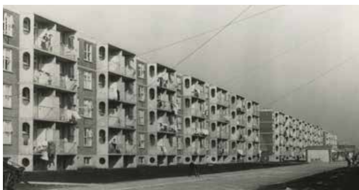
Aad woonde aan de Meppelweg. Foto uit 1954, H.A.W. Douwes, Haags Gemeentearchief