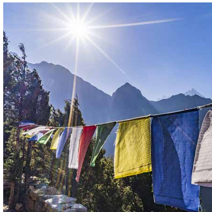
Tibetaanse gebedsvlaggen.

Het was van korte duur want in 1810 lijfde Napoleon Nederland in bij Frankrijk en gold de Franse vlag. Met de terugkeer van de zoon van Willem V als koning Willem I (1815) werd de Statenvlag in ere hersteld. Het was geen punt van discussie, ook niet