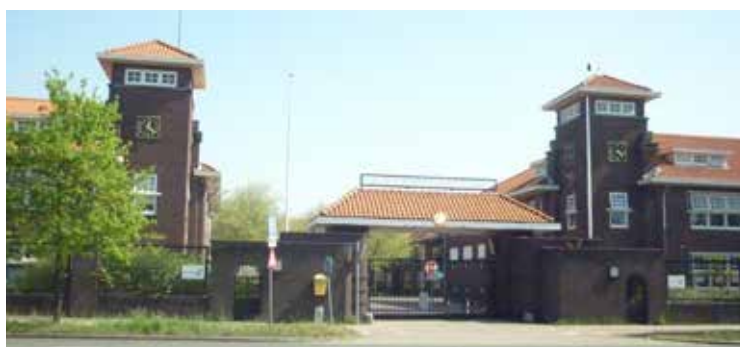
Alexanderkazerne aan de Van Alkemadeaan, waar Nick in 1986 dienstplichtig sergeant was.

Omdat de berghelling bezaaid was met stenen en kleine rotsblokken, liep vooral Aad die dag ernstige verwondingen op. Achteraf schatte Nick dat hun valpartij over de rotsachtige