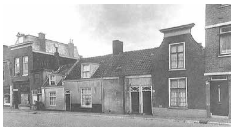
Wassenaarsestraat 101-109 1934