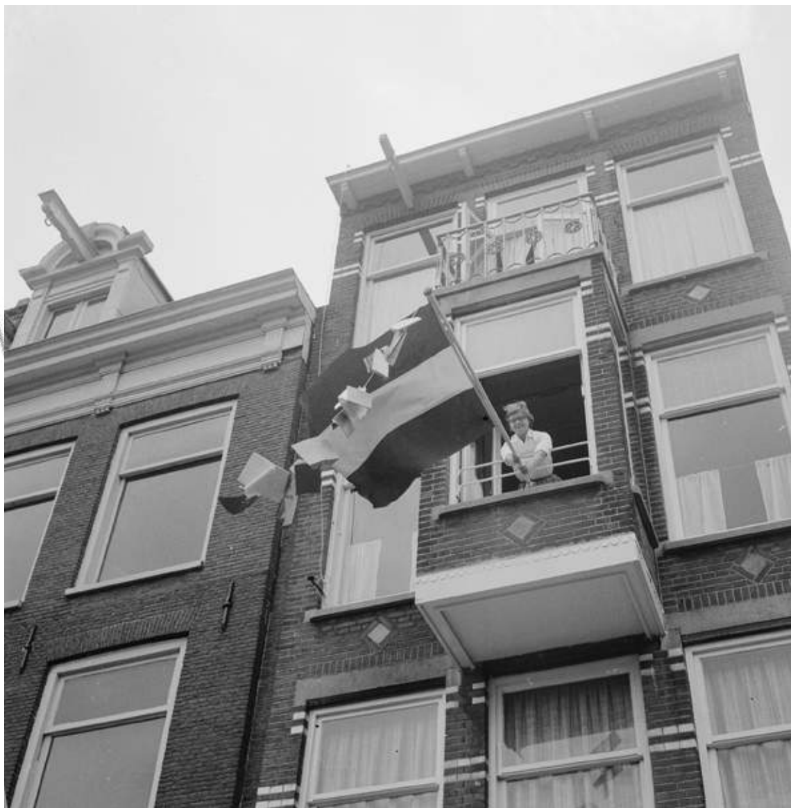
Vlag uit geslaagd voor eindexamen MMS, dochter en ouders vlag waaraan boeken zijn gebonden. Foto uit 1964, Hugo van Gelderen, Anefo, Wikimedia commons

Ton van der Pijl Tonvanderpijl212@gmail.com