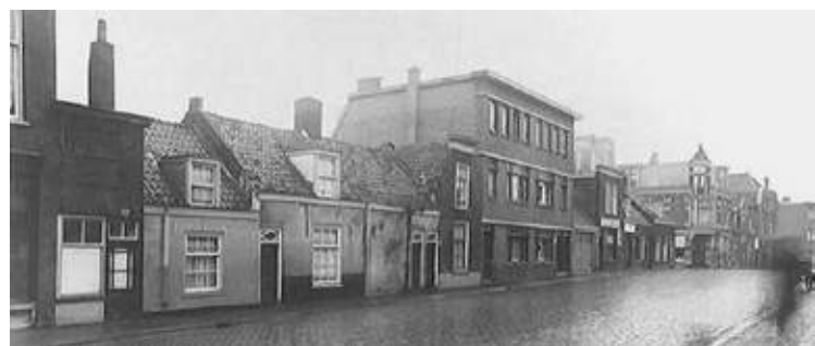
Wassenaarsestraat 107-79 in 1934

Een leuk plaatje van Scheveningen van Wim Beerends (zie De Haagse Tijden 18-3-2025). Het betreft hier de Wassenaarsestraat gezien naar de Keizerstraat omstreeks 1929. De vissershuisjes rechts zijn de nummers 105 tot 103, toentertijd bewoond door de families Van de Toorn en De Niet, beide vissers. Het geheel werd korte tijd later gesloopt voor de bouw van enkele portiekwoningen, de huidige huisnummers 105 t/m 111. Maar... de schilder heeft zich wat vrijheden veroorloofd. Ten eerste staat het beeld in spiegelschrift (de woningen bevonden zich in werkelijkheid aan de linker zijde van de Was-