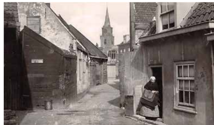
Nieuwe Laantjes eind jaren twintig vorige eeuw