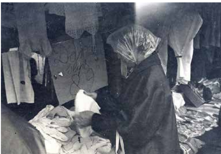
Mijn moeder op de Haagse Markt in 1959