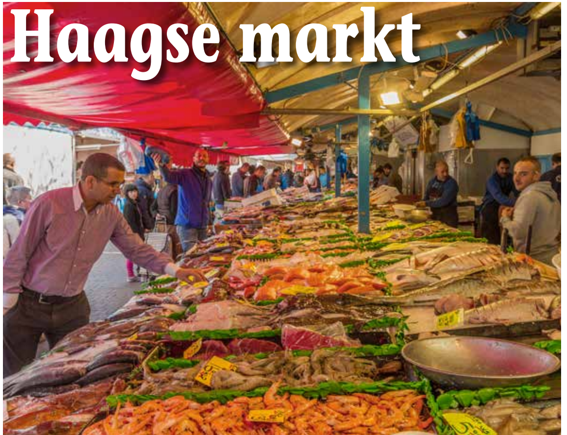
Viskraam op de Haagse markt.

Moeder wilde altijd even langs de kramen waar stoffen werden verkocht. Als er voordelige lappen waren, kocht ze er soms