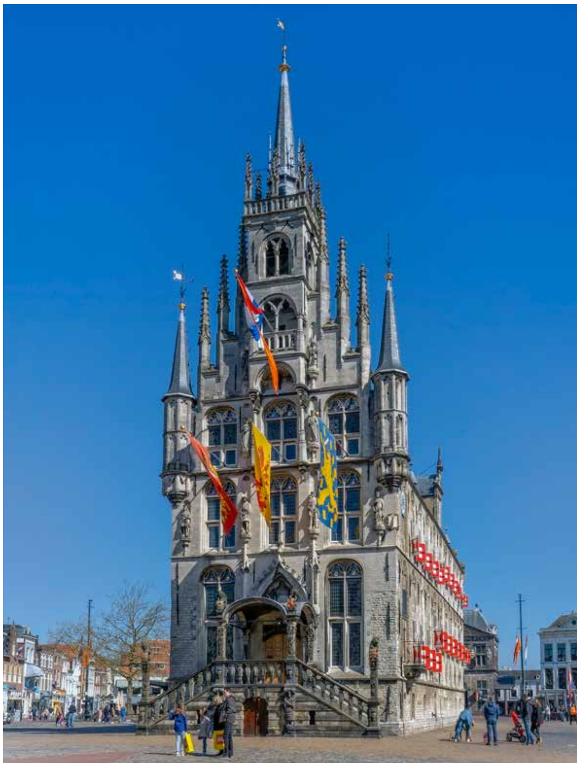
Oude Stadhuis (van Gouda) met vlaggen op Koningsdag.