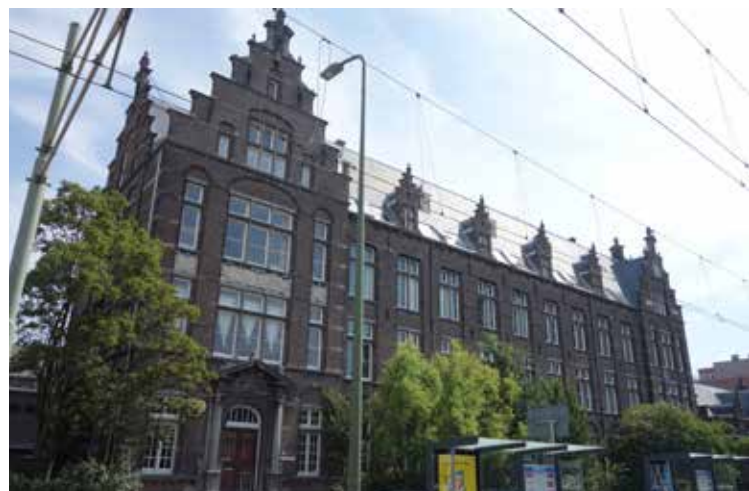
Waldeck Pyrmontkade.

Sinds 2002 is het een woon- en werkpand met 25 woningen en 15 bedrijven. In 2001 wilde de gemeente het pand (dat op de monumentenlijst stond) slopen,