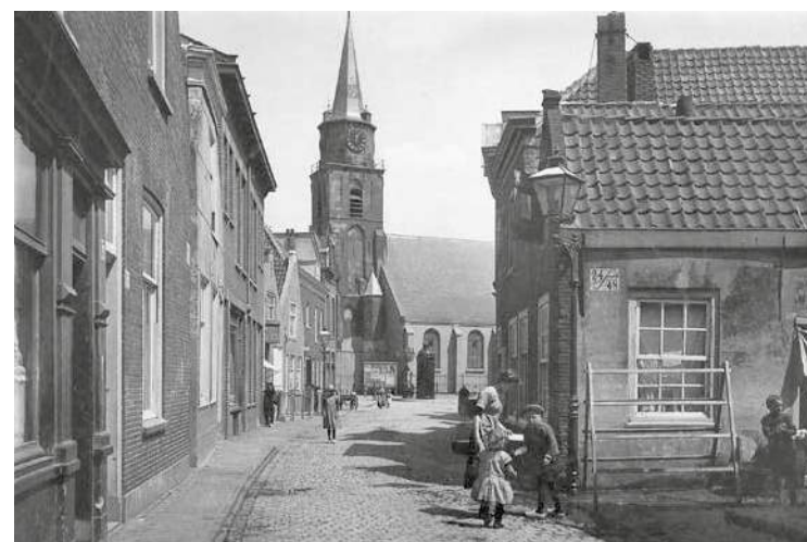
Jacob Pronkstraat rond 1920

mistige velden als in een waas maar nergens zie ik een Paashaas