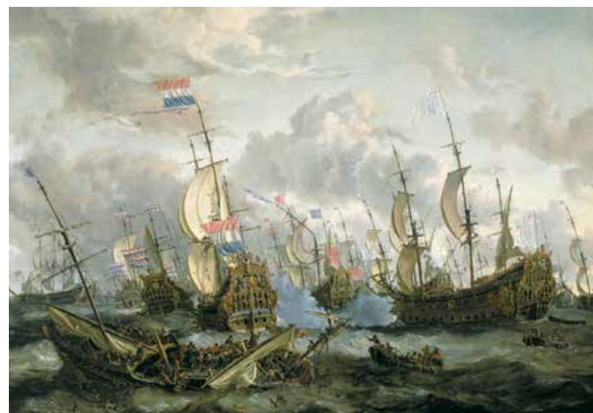
De vierdaagse zeeslag