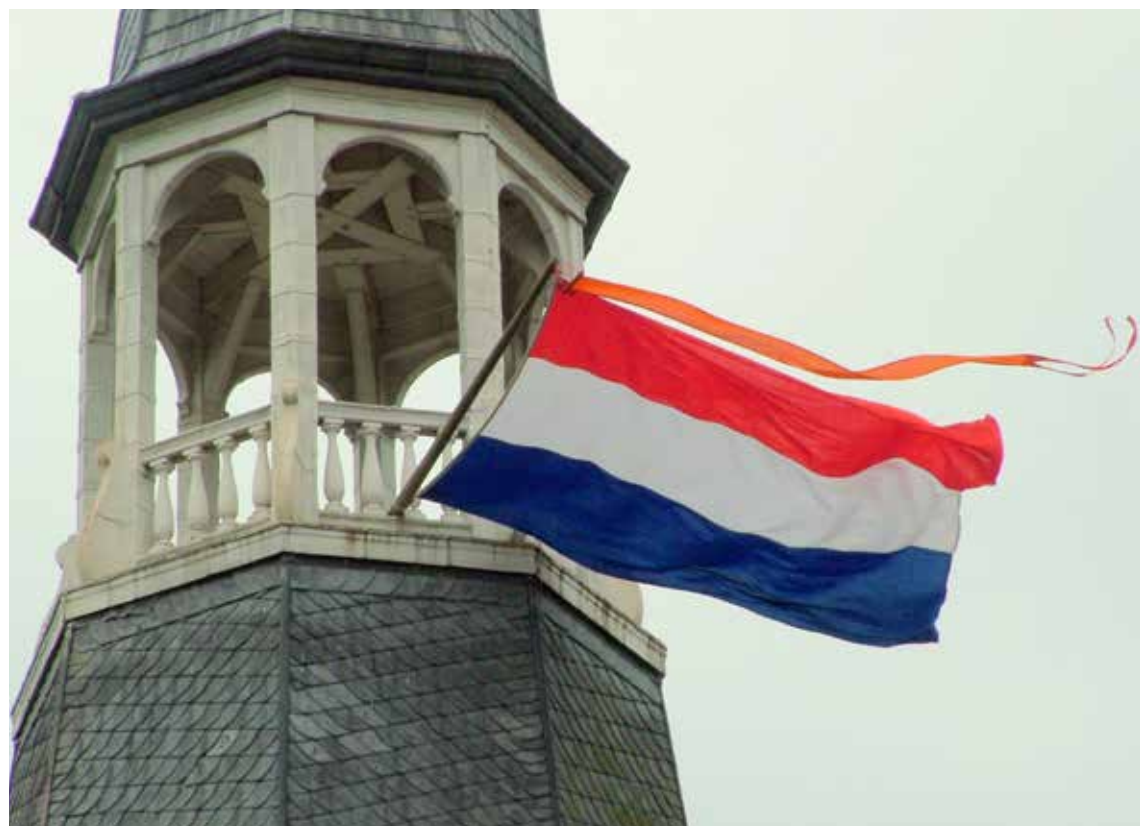
Vlag aan de kerktoren.

Met het naar de achtergrond raken van de Prinsenvlag en het verbod erop in de Bataafse en Franse tijd werd in de negentiende eeuw toch de behoefte