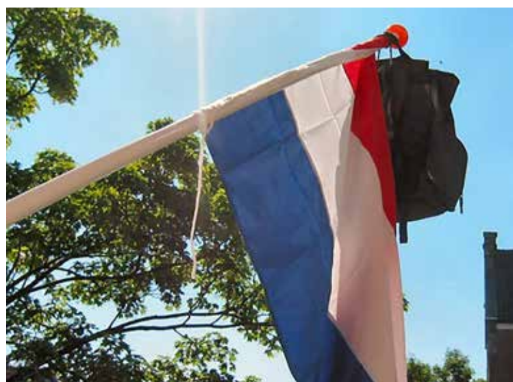
De 'geslaagd' vlag.

Z o tegen de zomer begint de periode van het uitbundig vlaggen. Dan volgen Koningsdag, Dodenherdenking en Bevrijdingsdag elkaar op met tussendoor de verjaardag van koningin Maxima en daarna de eindexamens. De vlag uitsteken mag iedere dag, maar dat bewaren we wel voor bijzondere gelegenheden en activiteiten. Op Koningsdag steken we de vlag zelfs uit met oranje wimpel en als je met vlag en wimpel slaagt voor je examen dan hangen we de schooltas bij de vlag. En als boeren boos zijn dan hangen ze de vlag ondersteboven. Maar hoe hoort het nu eigenlijk en was de vlag altijd al rood-wit-blauw?