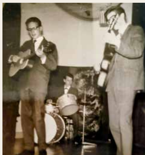
Schoolband Ariens Mulo