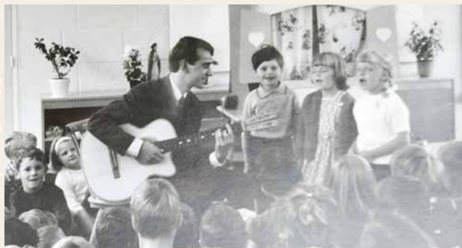
Samenzang in de klas van de lagere praktijkschool

Jaren later trad ik met koormuziek van Het Nijmeegsch Mannenkoor op in hartje Den Haag, een mij dierbare herinnering; tezamen en afgewisseld met de Die Haghe Sangers, al eerder genoemd en beschreven in een artikel van De Haagse Tijden. De schrijver van dit stuk zal zich kunnen herinneren dat hij vervolgens met zijn koor optrad in De Vereeniging, het concertgebouw in Nijmegen. Dit alles zou je kunnen samenvatten in de 'Haagse Wortelen' van mijn 78-jarig bestaan; met liefde kijk ik naar de Haagse aarde, waarin ik ben geplant.