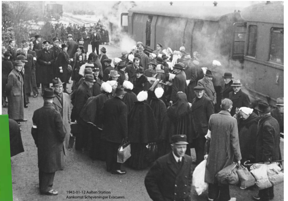
Aankomst Scheveningse evacuees station Aalten 12 jan 1943.

De geschiedenis vermeldt dat het door de Duitsers bezette Westen verdedigd moest worden tegen mogelijke invallen van de Geallieerden. Na de mislukte aanval op Engeland wilden de Duitsers geen tweede front, naast het oostfront. Hiertoe besloot Hitler tot de aanleg van de Atlantikwall als verdedigingslinie langs de gehele kuststrook, van Frankrijk tot aan Noorwegen aangelegd. Dit had voor de Scheveningse bevolking grote