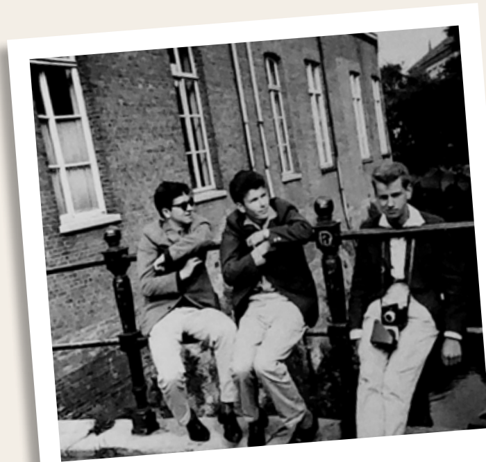
De popgroep op trektocht langs jeugdherbergen