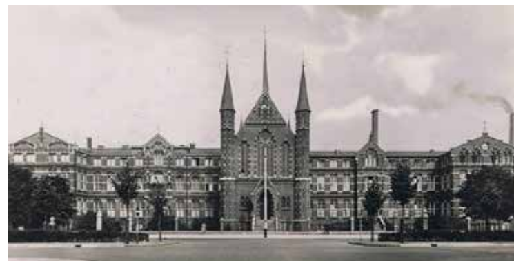
Groenestein, Loosduinse weg