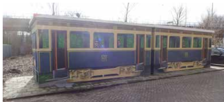
Muurschildering de Blauwe tram

In de oorlog wordt een deel van de NZH-lijn naar Scheveningen opgebroken. In 1948 wordt een en ander in ere hersteld, maar in 1958 is de verbinding niet meer lonend. NZH stopt ermee.