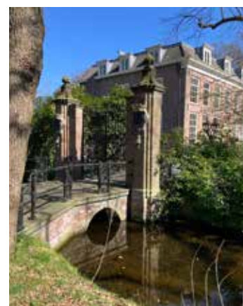
Toegang huis Overvoorde