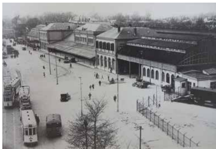
Station SS. Foto uit een boek over de geschiedenis van het Bezuidenhout

Vanaf perron 1 (rechts van je) kwam je ook op perron 2. Want het station was een kopstation. Je liep als het ware om de stootblokken die de sporen afsloten heen. Een overkapping uit glas en staal, in tweevoud boven je hoofd. En als je mazzel had, stond er nog een reusachtige locomotief voor je neus die nog weg moest rangeren om plek te maken voor de volgende binnenkomende trein. Wat ik toen niet wist, nu wel, is dat het station op 1 mei 1870 openging. Destijds voor de in 1845 opgerichte Nederlandsche Rhijnspoorweg-maatschappij NRS. Het station heette ook Den Haag NRS. In 1890 werd NRS overgenomen door de staat, die in 1863 de Maatschappij tot