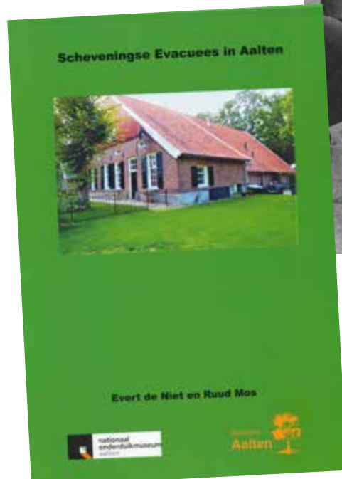
Scheveningse Evacuees in Aalten

Op Scheveningen ging men nauwelijks op vakantie. Van Aalten had men nooit gehoord; het was een vreemde omgeving en er waren communicatiestoornissen door de verschillende dialecten. De Scheveningse evacuees waren als het ware de uitgestotenen en hebben ook betaald met hun menselijk geluk. Vele ouderen hebben Scheveningen nooit meer terug gezien. Huwelijken vonden plaats, waarbij de Scheveningers zich hebben gevestigd in de evacuatieplaatsen. Veel Scheveningers hebben de contacten met bewoners in de evacuatieplaatsen onderhouden, zo ook met Aalten - zelfs nu de helft van de Scheveningse evacuees niet meer in leven is, heb ik