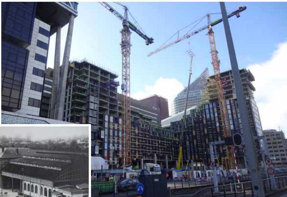
Nieuwbouw aan de kant van de Bezuidenhoutseweg

huidige Oranje Buitensingel. Verder staan er alleen woningen ten zuiden en ten noorden van het station, in inmiddels verdwenen straten met namen als Daendelsstraat, 1e, 2e, 3e van den Boschstraat, Ternootstraat en Fr. Valentijnstraat. Mijn vader liep er nog de deuren af met de collectebus. Geen Babylon, Appenrots, Utrechtsebaan. Geen Prins Bernhardviaduct (1975), geen tramviaduct het centrum in (1976), geen hoogbouw. De kruising Rijnstraat/Bezuidenhoutseweg is nog een échte kruising, met verkeer en zonder verkeerslichten. Gewoon met 'oom agent' midden op de kruising, die met zijn ingenieuze klapbord vol hendels, een fluit en handgebaren de verkeersstromen stuurde. "Mevrouw, als u niet kunt fietsen, doe het dan niet", zo kreeg mijn moeder er ooit te horen.