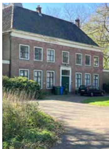
Huis De Voorde