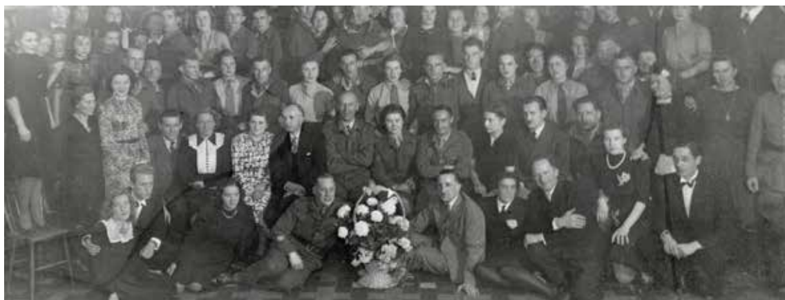
Een deel van de foto die ik vond, met op de voorgrond in het midden mijn ouders

T ijdens het leeghalen van een doos waarin papieren van mijn vader zaten, vond ik een map waarin onder andere een heel grote foto zat. Op deze foto staan en zitten minstens honderd mensen. Mannen en vrouwen. Een groot aantal daarvan in uniform. Uitgaande van een brief die er bijgevoegd is, is deze foto op 31 december 1946 gemaakt. Bovenaan die brief staat Nederlands Volksherstel afdeling 's Gravenhage. Op de voorgrond in het midden zitten mijn ouders. Die bijgevoegde brief geeft aan waarom die foto gemaakt is. Wat was dat eigenlijk, Nederlands Volksherstel, zo vroeg ik mij af.